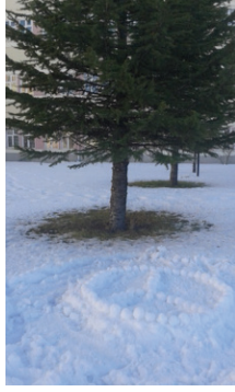
Görsel 1. "Barış"