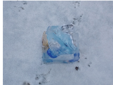
Görsel 14. "İsimsiz"

Görsel 13-14'de, su tüketimine ve su kirliliğine ilişkin su içine çöpler koyarak dondurulan bir çalışma görülmektedir. Çöp olarak günlük su tüketiminde kullanılan plastik pet şişeleri ile kapakları ve ambalaj atıkları kullanılmıştır. Buz heykel etkisindeki bu çalışma estetik bir olgunluğu da sahiptir. Biyoloji öğrencisinin gerçekleştirdiği bu çalışmada öğrenci Rana sylvatica türü bir ağaç kurbağasından esinlenerek yaşamak için, yaşamsal faaliyetlerini neredeyse durma