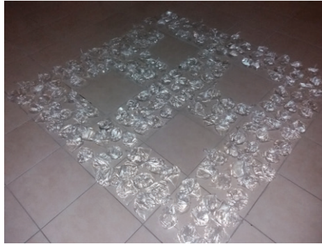
Görsel 8. "İsimsiz"

Görsel 8'deki iş de 189 adet plastik poşet içine doldurulan su ile yaklaşık 2 metrelik bir kare alanda oluşturulmuştur. Bir birim elemanı olarak su dolu poşetlerle farklı etkiler araştırılmıştır. İç mekân zemininde gerçekleştirilen bu düzenlemede saydamlık ve ışık etkisiyle oluşan yansımalarla göze hoş görünüm elde edilmiştir.