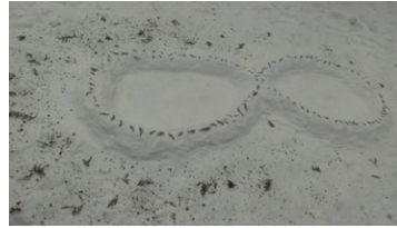
Görsel 4. "Sonsuzluk"

Görsel 3'te genellikle çöl iklimi, çöl sıcağı ile birlikte düşünülen Mısır Piramitlerinden esinlendiğini belirten öğrenci, kartopları ile oluşturduğu piramit görünümlü düzenlemeyle soğuk-sıcak karşıtlığından faydalanmıştır. 204 adet 5 cm'lik kartopları ile gerçekleştirilen ve "Piramit" adı verilen çalışmada, sanatta karşıt ilişkilerle yaratılan gerilimin dikkat çekici özelliği naif de olsa sezilenmektedir. Çalışma, iki farklı etkiyi, iki farklı coğrafyayı ilişkilendirerek su ve susuzluk karşıtlığı üzerine düşünmenin bir yansıması olarak değerlendirilebilir. Görsel 4'de, sonsuzluk simgesi karla biçimlendirilerek, yüzeyde yüksek kabartma etkisinde yapılmıştır. Doğanın sonsuz döngüsüne göndermede bulunduğu görülür.