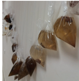
Görsel 10. Görsel 9 dan Detay