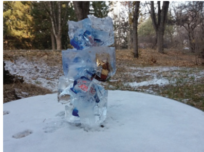
Görsel 13. "İsimsiz"

Görsel 12'de, insan kişiliğini ve kişisel birikimlerini, alan bilgisinden faydalanarak çevre sorunları ile ilişkilendiren psikoloji öğrencisi, sözlü ifadesinde duvar yapma nedenini insanların yapabilecekleri ve düşünecekleri şeyler konusunda aslında bir sınır olmadığını, sınırları kendilerinin koyduklarını, ancak bu sınırları yine kendilerinin yıkabileceğini düşündüğünü belirtmiştir. Bu düşünceden esinle kardan tuğlalarla duvar örerek yaklaşık üç metre uzunluğunda ve bir metre yüksekliğindeki "Duvar" adlı çalışmasını gerçekleştirmiştir.