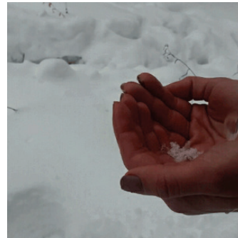
Görsel 18. "Yaşam", Animasyon