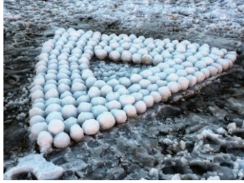
Görsel 5. "Örüntü"

Çalışmalarda gözlemlenen ortak özelliklerin başında birim tekrarları gelmektedir. Düz ve ters konumda basit tekrarların yanı sıra biçim, hareket, yön, boyut tekrarı kullanılarak birimin değişkenleri yoluyla ulaşılan ritmik düzenin yakalanabildiği işler ortaya çıkmıştır. Görsel 5 ve 6 da bu tekrarlarla oluşturulmuş uygulamalardandır.