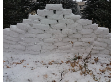
Görsel 12. "Duvar"

Görsel 11'de, 23 adet ağaç gövdesi üzerine yerleştirilen kartoplarıyla, alışılmış bir görünümün, basit tekrarlarla sanatsal bir anlatıma ve eğlenceli bir oyuna dönüştürüldüğü gözlenmektedir.