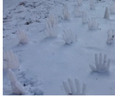
Görsel 16. "Yardım"

Görsel 15-16, doğanın insan eliyle kirlendiği olgusunu buzdan ve kardan ellerle ağaç üzerine ve karla örtülü toprak zemine yapılmış yerleştirmelerdir. İnsanın doğaya müdahalesi kurgusal bir düzenlemeyle yorumlanmıştır. Çalışmalar buzdan ve kardan ellerin tekrarı ile ulaşılan zengin çağrışımlara sahiptir.