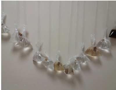
Görsel 9. "Doğanın Gücü"

Görsel 8'deki iş de 189 adet plastik poşet içine doldurulan su ile yaklaşık 2 metrelik bir kare alanda oluşturulmuştur. Bir birim elemanı olarak su dolu poşetlerle farklı etkiler araştırılmıştır. İç mekân zemininde gerçekleştirilen bu düzenlemede saydamlık ve ışık etkisiyle oluşan yansımalarla göze hoş görünüm elde edilmiştir.