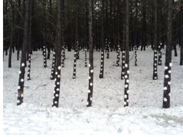
Görsel 11. "İsimsiz"

Görsel 9, iç mekânda duvar üzerine 360 cm uzunluğunda, yarısı su ile dolu poşetler asılarak düzenlenmiştir. 45 adet plastik poşet ve su içinde 2-3 adet meşe palamudu konmuştur. Suyun içine bıraktığı meşe palamutlarının her gün suyun rengini değiştirmelerine tanık olduğunu belirten öğrenci, canlı ve su ilişkisi ile doğanın sessiz dönüşümünü izlemeyi heyecan verici bulduğunu ifade etmiştir. Aynı zamanda suyun yaşamdaki her şeye dokunduğunu, suyun yaşam olduğunu yeniden düşünme fırsatı bulduğunu belirtmiştir. İşin gerçekleştirilmesinde suyun dalga hareketini kullandığı görülmektedir. Biçim ve içerik açısından da tutarlı bir ilişki kurduğu söylenebilir.