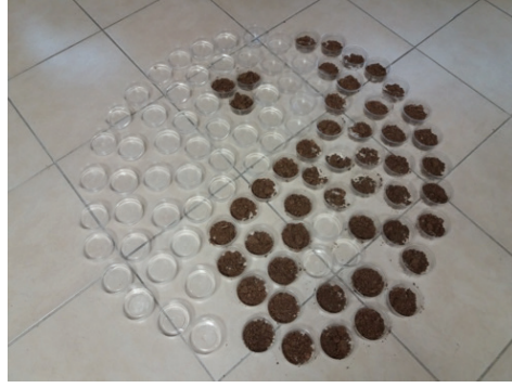
Görsel 2. "Yin-Yang"

İçinde bulunulan toplumsal ve sosyal ortamın, ülke gündeminin, savaş, kargaşa gibi olayların neden olduğu gerginlik ve huzursuzluktan kurtulma isteğinin sonucu barış simgesinin (Görsel 1) yansıtılması olarak görülebilir. 'Yaparken düşünmeyi öğrenen sanatçılar' gibi, bu çalışma, çevrede olup bitenlere kayıtsız kalmamanın bir sonucu olarak görsel sanatlardaki gözle düşünme mantığının güzel bir örneğidir. "Düşüncelerimiz gördüklerimizi etkiler, gördüklerimiz de düşüncelerimizi" (Arnheim, 2007, s.30). çünkü algı ve düşünme birbiriyle ilgilidir. Dolayısıyla algı ve düşünme sanat ve hayat arasındaki ilişkilerde olduğu gibi bireysel ifadenin de temelini oluşturur. Bu nedenle çağın sorunlarının algılanması ve düşünceler üretilmesinde ya da sorunların görünür kılınmasında sanatın gücü yadsınamaz.