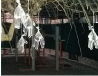
Görsel 15. "Yardım"

Suyu biçimlendirme sürecindeki arayışlarda, bireysel farklılıkların yansıtılmasında, öğrencilerin aldıkları eğitim alanlarının katkıları açıkça gözlenmektedir. ‘Sanat için yararsız bilgi yoktur’ ifadesini doğrulayan örnekler ortaya çıkmıştır. Bu da bir alanda edinilen bilgilerin bir başka alana transfer edilebildiğinde olumlu sonuçlar verebileceğini ve asıl konuya bakışı zenginleştirceğini göstermektedir. Çünkü sanat da bilim gibi bir bilgi edinme yoludur. Ancak çalışma yöntemleri farklıdır.