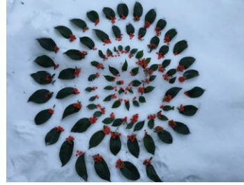
Görsel 6. "İsimsiz"

Görsel 7, bir iç mekân düzenlemesidir. 20 metre uzunluğunda, 40cm genişliğinde zemin üzerinde, 150 adet plastik poşet, su ve renkli kartonlar kullanılmıştır. Yarısu dolu poşetlerin altına yerleştirilen renkli kartonlar ile bir doğa olayı olan gök kuşağı etkisi yakalanmaya çalışıldığını gösterir.