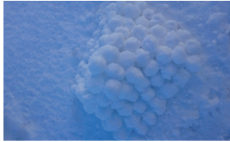
Görsel 3. "Piramit"

Doğanın karşıtlarıyla bir bütün olabildiği fikrine dikkat çekme isteği ile yapıldığını düşündüren Görsel 2'deki çalışmada, çapı 112cm olan bir alanda; 50 âdeti su, 50 âdeti toprak ile doldurularak 100 adet plastik kâse kullanılmıştır. Evrendeki karşıtlık ilişkisinden yararlandığı anlaşılan ve kökeni eski felsefi öğretiyeye dayanan bir yaklaşımla; doğanın sıcak-soğuk, gece-gündüz gibi birbirine zıt ama birbirini tamamlayan özelliği yansıtılmaktadır. Suyu sanatsal anlamda biçimlendirme kaygısı sonucu ortaya çıkan, doğal ve yapay (su ve toprak ile plastik) nesne kullanımıyla da karşıtlık sezdirilmiştir.