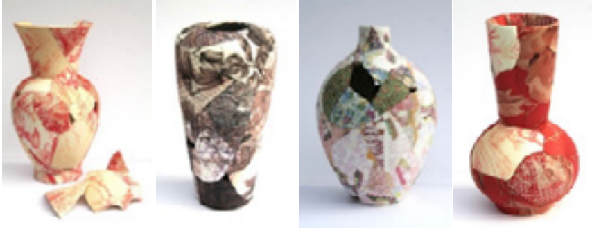
Görsel 6: Dijital Print Collection(Dijital Baskı Koleksiyonu), Zoe Hillyard, 2012

Zoe Hillyard kumaşın yanı sıra kullandığı kumaş desenlerini dijital baskı yöntemi ile seramik yüzeyler üzerine uygulamaktadır. Gerçek kumaş ve baskı yönteminin birlikteliği ile ortaya çıkan eserler beğeni toplamış ve British Müzesi gibi önemli müzelerin koleksiyonlarında daimi olarak sergilenmektedir.