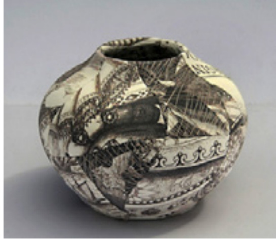
Görsel 4: Soyut Seramik Vazo – Zoe Hillyard

Uluslararası bir üne sahip olan Zoe Hillyard, özünde kumaşla uygulanan kırkyamayı bozmadan, seramikle bir araya getirerek farklı bir anlatım yakalamıştır. Sanatçı geleneksel el dikişli kırkyama tekniğinden esinlenerek alışkın olduğumuz formlarla dokunsal bir estetik yaratmaktadır. Sanatçı çalışmalarında üç farklı şekilde uygulamaya gitmiştir. Birincisinde kumaşı birebir seramik ile kullanmış ve kırık seramik parçaları kumaşlarla kaplayarak birleştirmiştir. İkinci yönteminde seramik parçalar üzerine kumaş desenlerini dijital baskı yöntemini kullanmayı tercih etmiştir. Üçüncü yöntemi ise Japon ‘yobitsugi’ tekniğinden faydalanarak yaptığı çalışmalarıdır. Bu işlemleri yaparken kırık seramik parçalarından faydalanmaktadır.