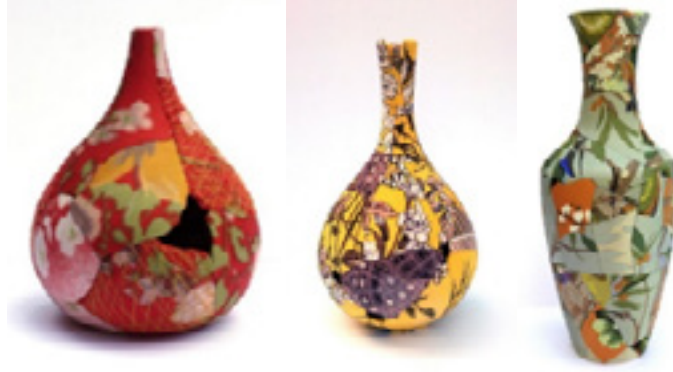
Görsel 5: Sarkis, Pilav ve Tartışma Yeri, 1995

Zoe Hillyard kumaşın yanı sıra kullandığı kumaş desenlerini dijital baskı yöntemi ile seramik yüzeyler üzerine uygulamaktadır. Gerçek kumaş ve baskı yönteminin birlikteliği ile ortaya çıkan eserler beğeni toplamış ve British Müzesi gibi önemli müzelerin koleksiyonlarında daimi olarak sergilenmektedir.