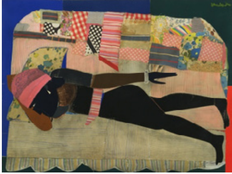
Görsel 2: Patchwork Quilt (Kırkyama Yorgan) 90.9 x 121.6 cm (1970)

1960 sonrasında ortaya çıkan kavramsal sanat akımı ile sanatta malzeme kavramı kalkmıştır. 'Kavramsal sanatta form önemsizdir. Düşünce; sayı, fotoğraf, kelime ya da başka herhangi bir yolla ifade edilebilir' (Bağatır, 2011:27). Bu bağlamda kırkyama yöntemini kavramsalcular da kullanmışlardır. Ünlü sanatçı Joana Vasconcelos birçok çalışmasında kumaşlardan faydalanmıştır. Küçük kumaş parçalarını birleştirerek oluşturduğu dev yapıtlar dünya çapında bir üne sahip olmuştur. Kırkyama tarzı yapılmış en bilindik çalışmalarından bir tanesi 'Contamination (Kirlilik)' adlı eserdir. 3 2011 yılında sergilenen bu eser Venedik 54. Görsel Sanatlar Bienali kapsamında Palazzo Grassi otelinin neredeyse hepsini kaplayacak şekilde yapılmıştır (Görsel 3).