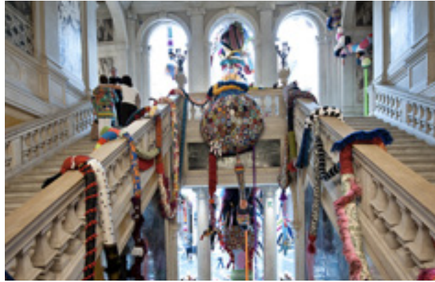
Görsel 3: Contamination (Kirlilik) (2008)