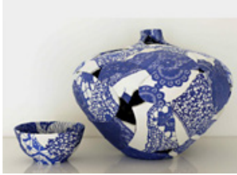
Görsel 8: Ceramic patchwork with lace inspired fabric – Zoe Hillyard New Brewery Arts -2013

Hillyard çalışmalarında Japon Kintsugi (Yobitsugi) tekniği denen kırık seramik parçalarının altınla birleştirilmesi sonucu oluşturulan kırkyama tipi çanak çömleklerden etkilendiği de görülmektedir. Kintsugi anlam olarak 'altınla tamir' yada 'altınlı yama' olarak dilimize çevrilmiştir. Bu bağlamda kintsugi de kırkyamanın seramik çeşidi olarak düşünülebilir. Hillyard 'ın Yobitsugu Japon 'Wabi-Sabi' öğretisi ile yaptığı çalışmalar İngiltere Cirencester'de bulunan New Bevery Arts da sergilenmiştir.