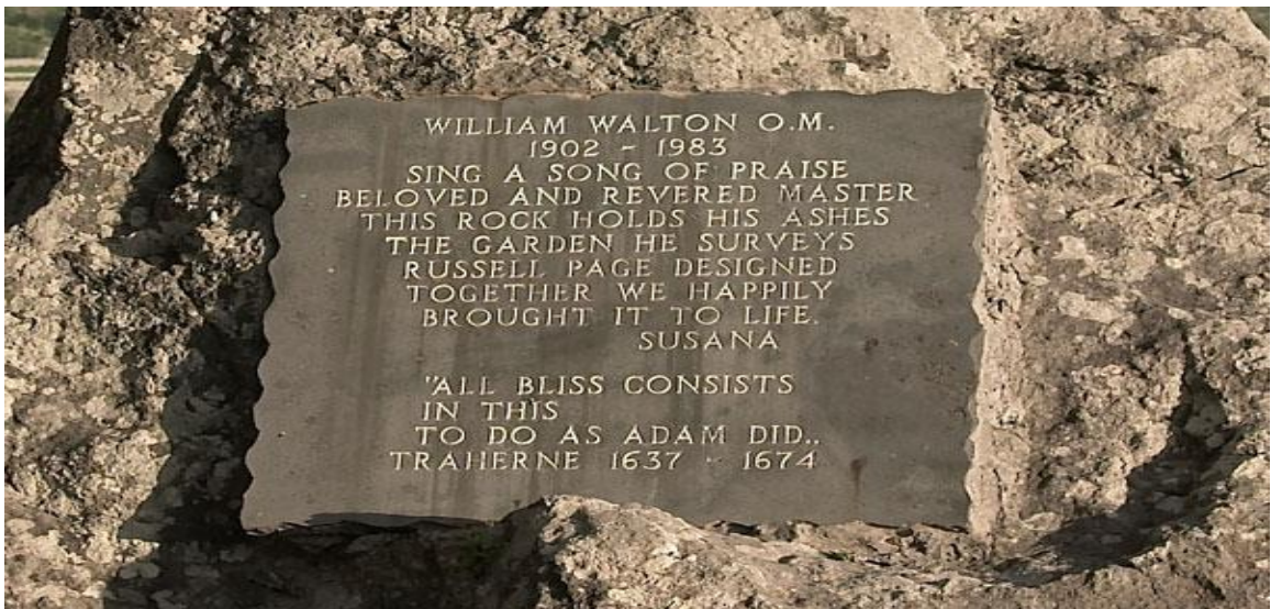
Resim 2. William Walton'ın Anıtı