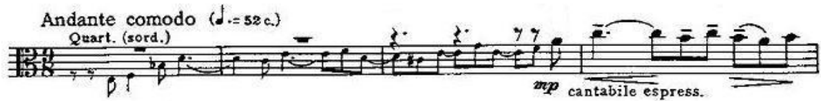
Şekil 1 (1. ve 4. ölçüler)

Ağır tempoda başlayan ilk bölümün genellikle sade ve melankolik bir yapısı vardır. A teması olan orkestranın liriksel girişi ve viyolanın teması, uzun bir gelişme kısmı ile zaman zaman müzikte yükselip alçalmalarla devam eder (1. ve 4. ölçüler: Şekil 1).