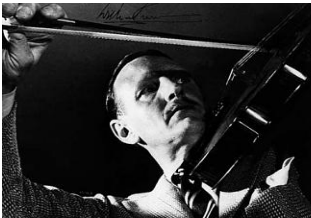
Resim 5. William Primrose