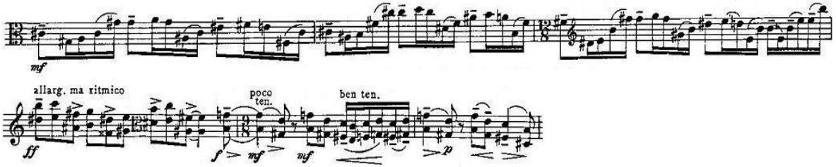
Şekil 3. (26. ve 31. ölçüler)

Üç kere tekrarlayan modülasyon dizisinin ardından kromatik iniş başlar (26. ve 31. ölçüler: Şekil 3).