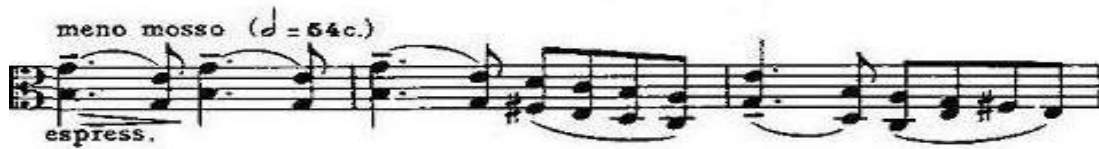
Şekil 16. (41. ve 43. ölçüler)

Ardından Meno Mosso 'daki duygulu B temasına bağlanır. (41. ve 43. ölçüler: Şekil 16).