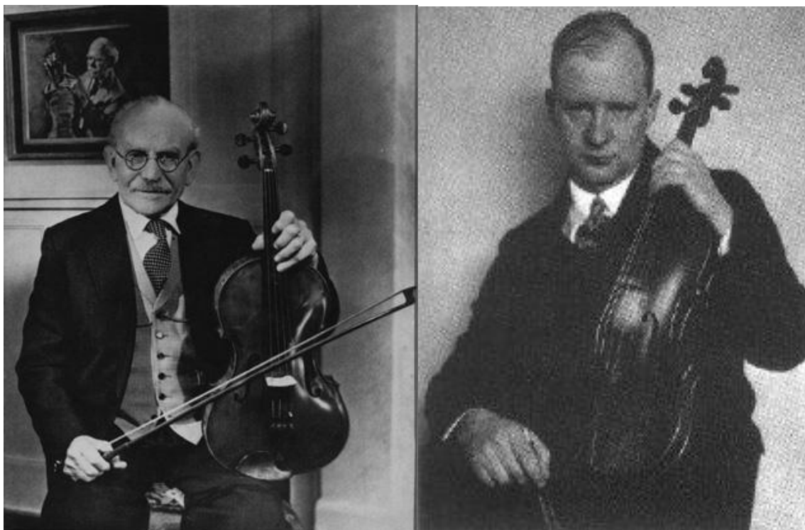
Resim 3. Lionel Tertis