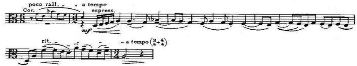
Şekil 4. (32. ve 35. ölçüler)

Kornların rallentando 'sundan sonra B teması gelir ve müziğe hüzünlü bir renk getirir (32. ve 35. ölçüler: Şekil 4).