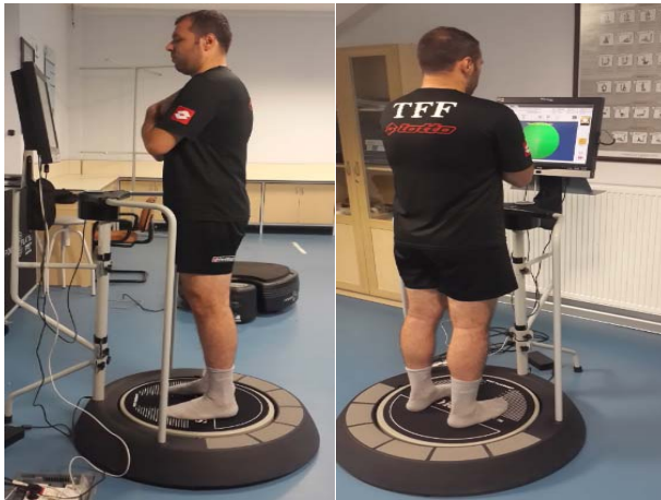
Şekil 13. Kinestetik Denge Ölçümü

Kinestetik Denge Ölçümü: Hakemlerin statik çift ayak denge ölçümü çıplak ayakla denge platformu üzerinde kinestetik denge cihazı (Şekil 13) ile yapılmıştır. 6PSI ayarlanan denge platformunda hakemlerin kolları göğüs önünde çapraz pozisyonda ve ekranda görülen “X” cursor işaretini merkez noktada tutması beklenmiş, test başlatılmış ve 30sn sonrasında otomatik olarak sonlanmıştır.