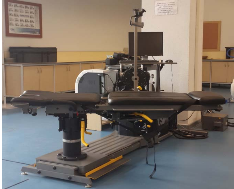
Şekil 6. Omuz Eklemi Proprioepsiyonu Ölçüm Aracı

Omuz Eklemi Proprioepsiyonu Ölçüm Aracı: Hakemlerin omuz eklemi proprioepsiyonu ölçümleri 30^\circ , 80^\circ ve 130^\circ açılarda CSMİ (Humac Norm Testing & Rehabilitation System, USA) (Şekil 6) izokinetik cihazı ile ölçülmüştür.