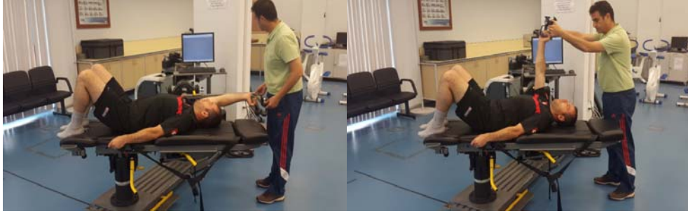
Şekil 12. Omuz Eklemi Propriozeptiyonu Ölçümü

Propriozeptif ölçüm için denekler sırtüstü yatırılmış ve gözleri kapalı konumdadır. Ölçümler eklem hareket açıklığının başında, ortasında ve son kısmında olacak şekilde propriozeptiyon ölçüm noktaları 30°, 80° ve 130°'ler seçilmiştir. Her ölçüm üç kez tekrarlanmış, her tekrarda 10 saniye hedef açıda beklenmiş ve pasif olarak başlangıç pozisyonuna geri dönülmüştür. Ardından deneğin hedef açıyı bulması istenmiş, bulunan açı izokinetik dinamometreden kaydedilmiştir. Kaydedilen değerlerle olması gereken açılar arasındaki fark hesaplanarak açısal hata bulunmuş ve üç ölçümdeki açısal hataların mutlak değer toplamı alınmıştır.