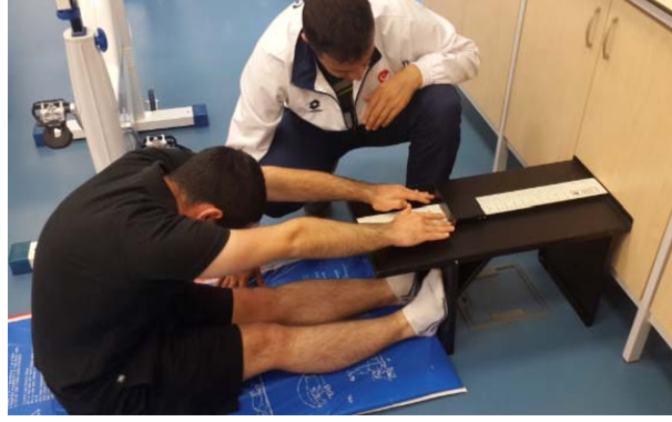
Şekil 8. Esneklik Ölçümü

Esneklik ölçümü: Hakemler yerde mat üzerine oturmuştur. Ayak tabanları sehpanın tablasına değdirilmiş ve dizlerin bükülmemesi sağlanmıştır. Gövdeden ileri doğru maksimum uzanincaya kadar ilerleyip cetvelin itilmesi istenmiştir. Test 3 defa tekrar ettirilip en iyi değer analiz için kullanılmıştır ( Şekil 8 ).