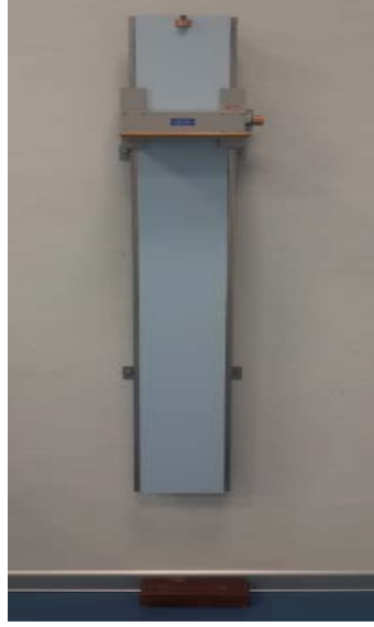
Şekil 1. Sabit Stadiometre

Boy Uzunluğu: Deneklerin boy uzunluğu ölçümleri hassasiyeti \pm 0.1\text{mm} olan stadiometre (Holtain Ltd, UK) ( Şekil 1 ) ile alınmıştır.