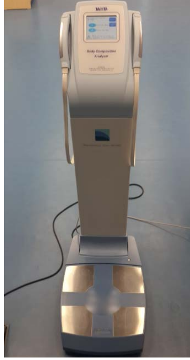
Şekil 3. Vücut Analiz Aracı

Vücut Yağ Yüzdesi: Hakemlerin vücut yağ yüzdesi biyoelektrik impedans cihazı (Tanita MC 180 Multi Frequency BIA, Japan) ( Şekil 3 ) ile değerlendirilmiştir.