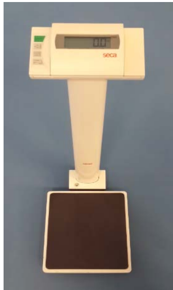
Şekil 2. Laboratuvar Baskülü

Vücut Ağırlığı: Deneklerin vücut ağırlığı ölçümleri \pm 0.01\text{kg} olan elektronik laboratuvar baskülü (Seca, Vogel & Halke, Hamburg) ( Şekil 2 ) ile alınmıştır.