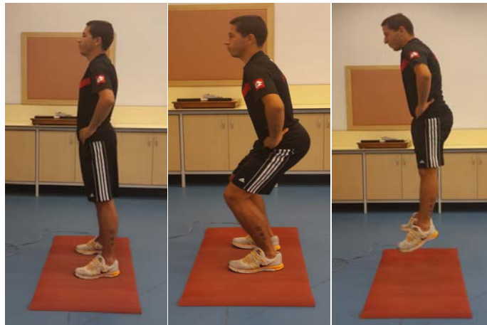
Şekil 11. Aktif Sıçrama Ölçümü