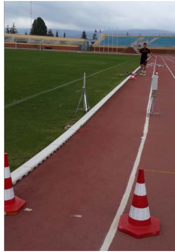
Şekil 9. Çeviklik Ölçümü (Agility 505 Test)

Test 2’şer dakika dinlenme verilerek 3 kez tekrar edilmiş ve en iyi süre analiz için kullanılmıştır.