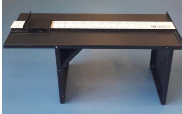
Şekil 4. Esneklik Testi Ölçüm Aracı

Esneklik: Hakemlerin gövde ve alt ekstremitte esnekliği otur-eriş sehpası (Lafayette Instrument Company, 01285A) ( Şekil 4 ) ile ölçülmüştür.