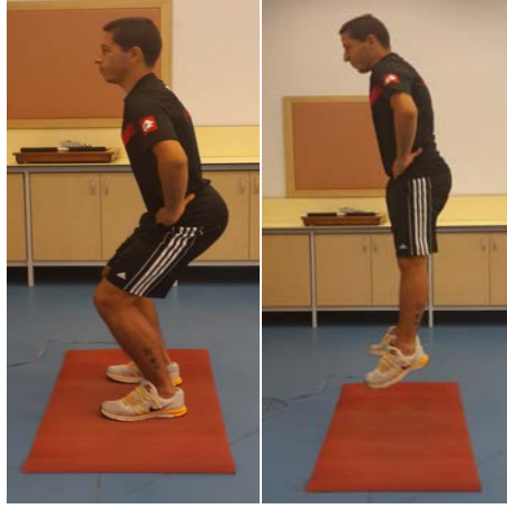
Şekil 10. Skuat Sıçrama Ölçümü

Aktif sıçrama testinde ise ayaklar omuz genişliğinde açık, eller belde, ayaktan dizler üzerine mümkün olan en kısa sürede 90° skuat pozisyonuna gelerek dikeye doğru sıçrama ( Şekil 11 ) şeklinde yaptırılmıştır. Hakemlerin, elleri belindeyken kalça ve dizlerinden güç alıp mümkün olan en yüksek seviyeye sıçraması istenmiştir.