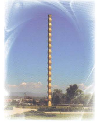
Resim 6., Brancusi, "Sonsuzluk Sütünü" 1919.

lanan bu çalışmada, form sanki boşluğu delerek gökyüzüne yükselecekmiş gibi dinamik yapıya sahiptir. Bu yapıtı hakkında Brancusi "hayatım boyunca yalnız uçmanın esasını aradım, uçmak bu ne mutluluktur. Bir çocuk gibi her zaman gökyüzünde ağaçlar arasında uçmayı hayallemişim. Her zaman bu arzuyu sakladım. Kırk yıldan beri kuş yaparım. Bunlarla anlatmak istediğim kuş değildir. Vermek istediğim uçuştur, hızdır" demektedir. Uçmak eylemi üstüne duyulan bu özlem sanatçının ürettiği heykelinde gerçekleşmiş, düşsel ve düşünsel anlamdaki öyküsünü ürettiği forma aktararak biçimlendirmiştir.