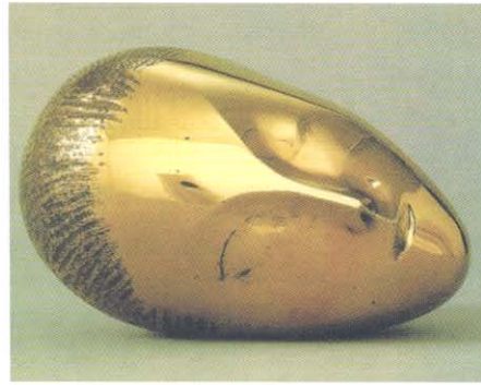
Resim 3, Brancusi, "Uyuyan Prenses" 1906.