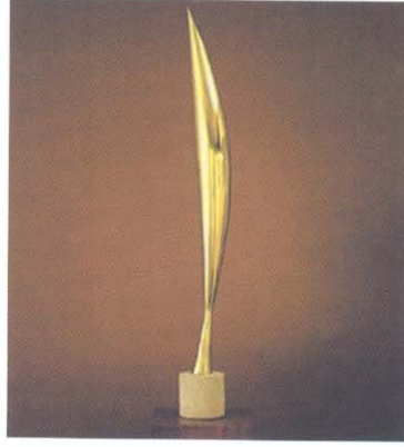
Resim 5., Brancusi, "Boşluktaki Kuş" 1919.