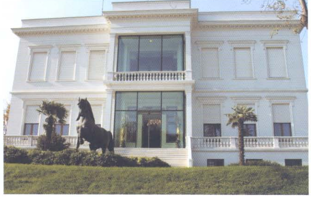
Sakıp Sabancı Müzesi, İstanbul

İngiltere'deki TI grubunun sanat koleksiyonu, 1980 sonrası başlamış olmasına rağmen sanat koleksiyonları ile zamanın muhafazakar hükümeti arasında kuvvetli bir sanat ilişkisi kurduğu görülmektedir. Genç Sanatçıları desteklemenin ve sanayi ile sanat arasındaki bağı güçlendirmenin önemini kavrayan TI sanayi şirketi, 1992 yılından itibaren "Royal Art College Okulu" tarafından verilen Sanat Grup Burslarının sponsorluğunu üstlendi. TI Sanayi Kuruluşu, "Royal Art College Okulunu" bitiren sanatçıların sanat eserlerinden birer seçki oluşturdu.