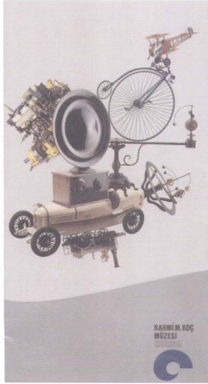
Suna ve İnan Kıraç Vakfı, Pera Müzesi, İstanbul