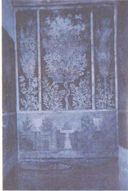
Resim 2- Pompei. Frutteto Evi. Duvar süslemesi (L.Curtius, Die Wandmallerei Pompejis, New York 1972, Tafel IV)