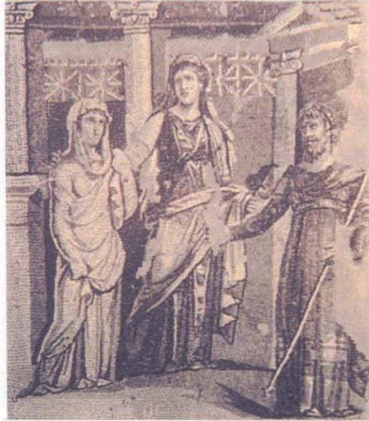
Resim 6- Antiokhia. Euripides'in Iphigeneia Aulis'tesinden sahne. (G.Downey, Ancient Antioch, Princeton 1961, Fig 22)