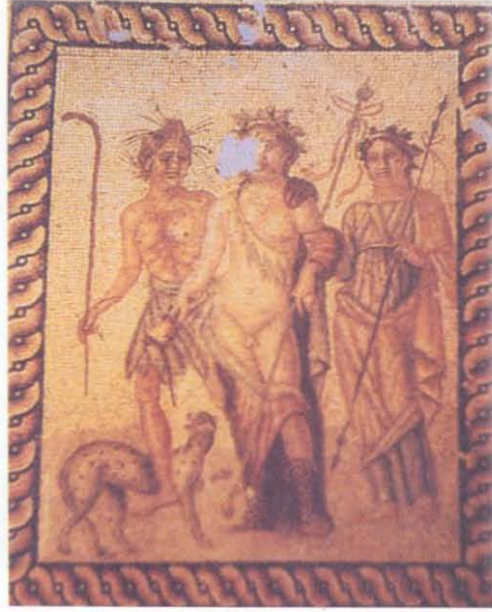
Resim 5- Antikhia. Sarhoş Dionysos Mozaïği Antakya Müzesi