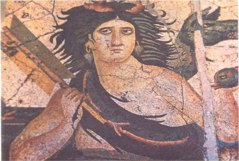
Resim 4- Antiokhia, Deniz Mozaïği Antakya Müzesi