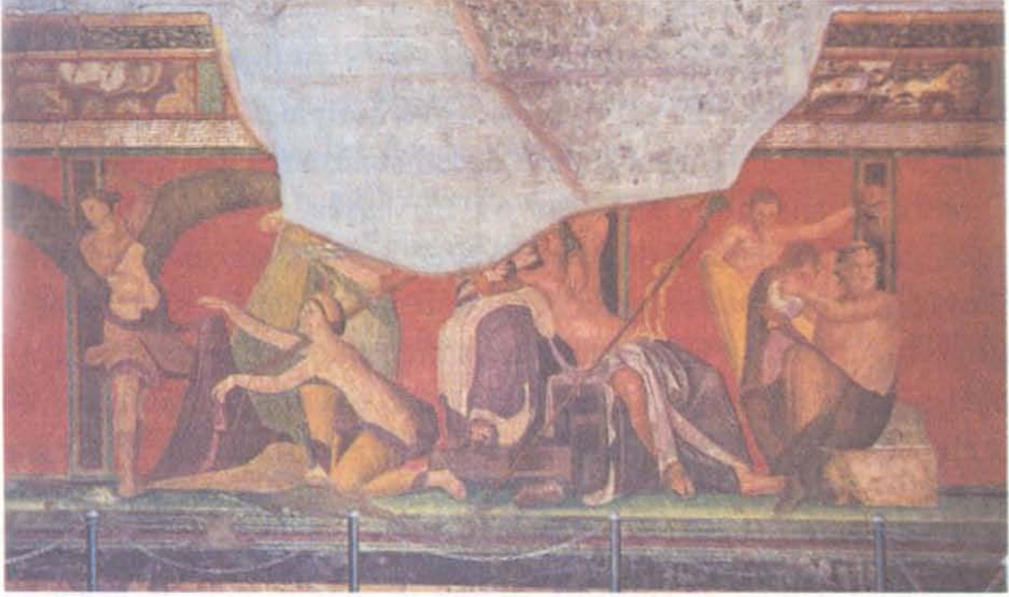
Resim 1- Pompei Mysterler Villası, Friz (L. Curtius, Die Wandmalerei Pompejis, New York 1972, Tafel I)