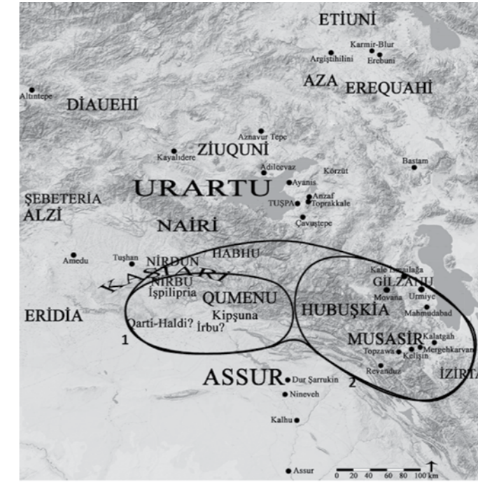
1. Assur kayıtlarına göre Haldi ile ilişkilendirilebilen coğrafya. 2. Musasir ve çevresi.