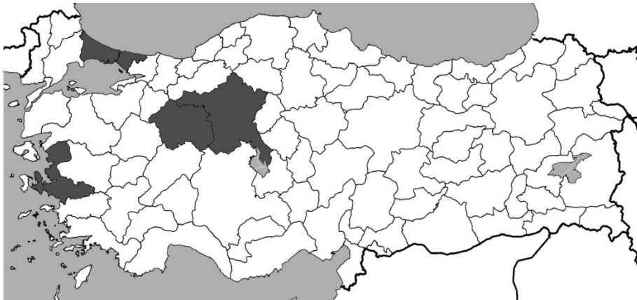
Şekil 1: 1992 Yılına Kadar Güzel Sanatlar Fakültelerinin İllere Göre Dağılımı

Ortaya çıkan çeşitli tartışma konularının gölgesinde ilerleyen dönüşüm süreci Anadolu’nun diğer illerinde açılan fakülteler ile devam etmiştir. (Şekil 1).