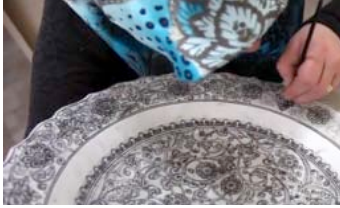
Görsel 27. Kütahya'da tahrir denilen kontürleme işlemi

Fırça ile yapılan dekor işleminde bisküvi bünye üzerine renkler sırayla desene göre uygulanır. Geleneksel yöntemle yapılan dekor işleminden sonra daldırma tekniği ile ürünler sırlanır. Sırlandıktan sonra kurumaya bırakılan ürünler gerek geleneksel gerekse elektrikli fırınlarda bünyenin özelliğine göre 900-1050°C aralığında pişirilir.