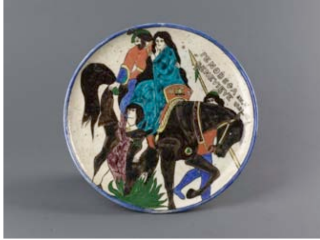
Görsel 24. 19. yy.sonu-20. yy. başı ( http://www.peramuzesi.org.tr/Eser/Tabak/160/3#!prettyPhoto .)

19. yy. sonu ve 20. yy. başında ise 1922 yılında vefat eden Osmanlı Çini sanatının Kütahyalı ustası 'Hafız Mehmet Emin Efendi' dönemin maddi-siyasi tüm sıkıntılara karşın atölyesini ayakta tutma çabası ile döneme imzasını atmış olup İstanbul Eyüp Sultan'da bulunan Sultan Reşat Türbe çinileri önemli eserleri arasında yer almaktadır. Aynı dönemde Kütahya'da önemli eserler üreten Hacı Minas, Kospik Kalos, Nurcancayan gayrimüslim çini ustalarındandır (Şahin, 1988, s.132-133).