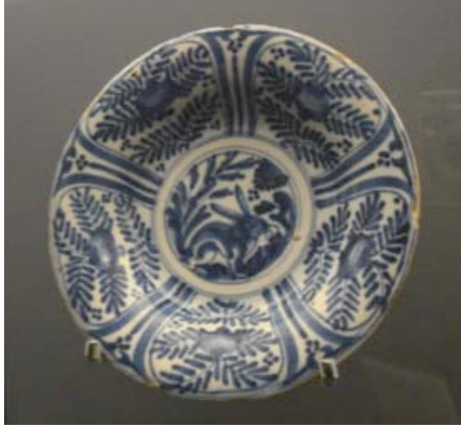
Görsel 1. 16. yy. Mayolika örnekleri, Madrid Dekoratif Sanatlar Müzesi, Talavera Bölümü Fotoğraf: Ezgi Martinez, 2009

Talavera'da mayolika tekniğiyle üretilen seramikler 15. yy'dan itibaren sırayla, bej zemin üzerine önce yeşil-siyah, sonra mavi renklere kelebek ve eğrelti otu desenleriyle ve ortasında maddalyon içinde hayvan motifleriyle mudejar stilinde karşımıza çıkar.