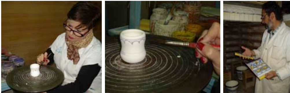
Görsel 12. Fırça ile mayolika dekorlarının yapılması

Daha sonra bu desenler ince olarak sulandırılmış mayolika boya ile özel fırçalar kullanılarak uygulanır. Mayolika dekor uygulaması son derece ustalık ve beceri isteyen bir yöntemdir. Dekor uygulaması biten ürünler yaklaşık 980°C'de pişirilerek ürünlerin aynı zamanda dekor pişirimi ile birlikte sır pişirimi de gerçekleştirilmiş olur.