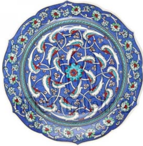
Görsel 26. Baba Nakkaş usulünde (merkezde rozet çiçek etrafında girift rumi motifleri Rumi motifleri) ( http://www.marmarapazarlama.com.tr/urunler.htm?kid=9 )

Sanatçı geleneksel Türk çinileri üzerine eser vermekte, Kütahya'da diğer çini ustalarından farklı olarak kendine özgü hammadde reçetesi ve motifleriyle dikkat çekmektedir. Kullandığı %85 kuvars içerikli bünyesi ve ipek matı sırları, onun eserlerini özgün kılmaktadır. Mesleğinde ilerleyişini hem özgün form ve dekorlarına, hem de teknik araştırmalarına borçlu olan sanatçı teknik olarak zayıflayan Kütahya çiniciliğine bu anlamda katkı sağlamıştır. Sanatçı İstanbul Edirne, Bursa gibi şehirlerde özellikle mimari çinileri araştırarak çalışmalar yapmış, 16. yy. çini sanatı koleksiyonlarını incelemiştir. Yiğit 16. yy. Kütahya çinilerinden 400 eserin renk desen form olarak replikalarını yaparak, 177 eserin tezhibini günümüze taşımış, ayrıca geçmişten miras kalan çini sanatını çağdaş tasarımlarıyla birleştirerek çini sanatını geleceğe taşımakta önemli bir misyon üstlenmiştir.