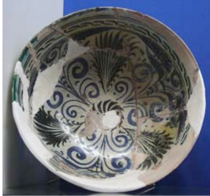
Görsel 19. 14-15.yy. Milet işi, Kütahya Çini Tabak http://chinichini.exblog.jp/14310255/

Genel olarak Osmanlı çini sanatı incelendiğinde İznik ve Kütahya üretim merkezleri farklı alt üslupta ürünlerle de birbirinden ayrılır. İznik üretimlerinde Mavi-Beyaz, Milet işi, Şam işi, Haliç işi, Rodos işi gibi farklı renk-desenin tanımlandığı ürünler verilirken; Kütahya'da daha yoğun şeffaf sır ile çoğunlukla bitkisel bezemeli ürünler ortaya konulmuştur.