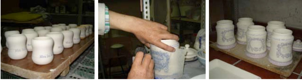
Görsel 9. Ham sırlı ürünler

Dekor yönteminde ağırlıklı olarak kullanılan mayolika tekniğinin uygulamasında ise; bisküvi pişirimi yapıldıktan sonra (1070°C) ürünler, daldırma yöntemiyle örtücü kalaylı sır ile sırlanarak altları silinip kurutulur. Böylece dekorlama için elverişli bir tabaka oluşturan sırlı yüzey kurutulduktan sonra ham sır üzerine mayolika dekor uygulamasına geçilir. Dekor süreci; parşömen kâğıdına deliklerle işlenen desenin toz halindeki kömür vasıtasıyla bu deliklerden ham sırlı yüzeylere aktarılmasıyla başlar.