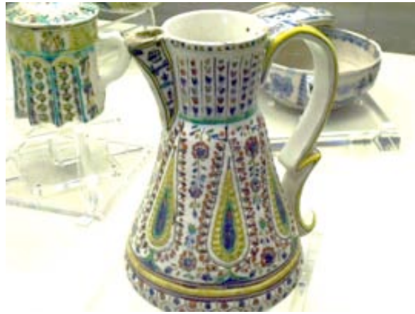
Görsel 20. 17. yy. Kütahya çini Sürahi, İstanbul Çinili Köşk

15.yy'da ise Kütahya çini sanatı başkent İstanbul'a ürün yetiştiren İznik'in gücüne erişemeyerek kendi özellikleri ile ürün vermede sınırlı kalmıştır. Ancak 16. yy sonrası İznik gücünü ve kalitesi sürdürmediğinden 17.yy'da ilginç bir biçimde Kütahya çini sanatında ilerleme dönemi olmuştur. Bu dönemde üretilen çinilerin dekorlarında İznik üretimlerine paralel; şakayık, lotus, karanfil desenlerin yanı sıra çin bulutu gibi bezemelerle üretimler yapılmıştır. Bu üretimlerin dışında üretilen ürünlerin bazılarında kırmızı renk kullanılarak şeffaf sır altı dekor uygulamaları yapılmış, dönemin önemli üretimleri arasında yer alan bu eserler 16. yy. İznik üretimi olup yanlışlıkla 'Rodos işi' olarak adlandırılan ürünlerin tekrarıdır. Kütahya'da üretilen bu ürünler İznik kalitesinde değildir. Bunun nedeni üretimde kullanılan sırnın daha kalın, bazen bulanık renkleri taşıması, cansız renkler ve desenlerdeki özensizliktir.