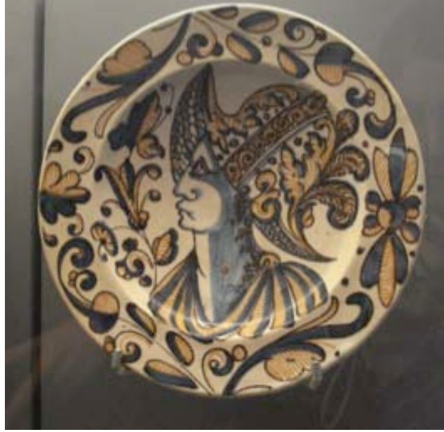
Görsel 2. 17. yy. Üç renkli (tricolor) mayolika örnekleri, Madrid Dekoratif Sanatlar Müzesi, Talavera Bölümü