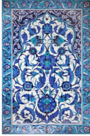
Görsel 29. Hatayi dekorlu çini pano