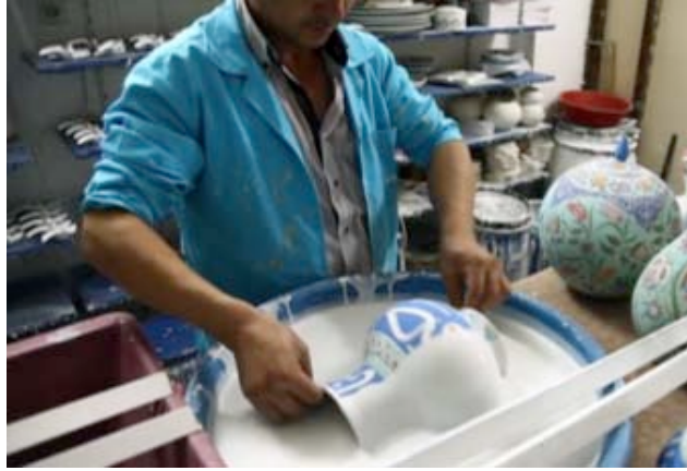
Görsel 28. Dekorlu ürünlerin sırlanması ( http://www.marmarapazarlama.com.tr/tanitim-filmi.htm )

Fırça ile yapılan dekor işleminde bisküvi bünye üzerine renkler sırayla desene göre uygulanır. Geleneksel yöntemle yapılan dekor işleminden sonra daldırma tekniği ile ürünler sırlanır. Sırlandıktan sonra kurumaya bırakılan ürünler gerek geleneksel gerekse elektrikli fırınlarda bünyenin özelliğine göre 900-1050°C aralığında pişirilir.