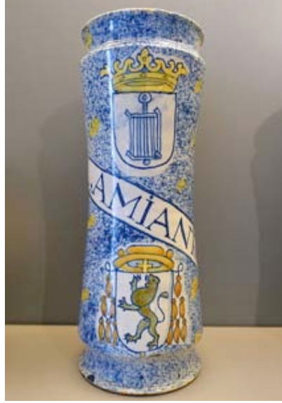
Görsel 3. 16. yy. Sünger dekorlu mayolika örneği albarello