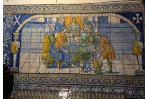
Görsel 30. Mayolika tekniği, Manzaralı Talavera Pano Görsel 31. Dini ve günlük yaşamı yansıtan Talavera Pano Nuestra Señora del Prado Bazilikası, Talavera

Rönesans ve Barok dönemlerde de seramikler üzerinde yine aynı konular devam ederken, üslupta bezemelerde mükemmelleşen desen ve fırça işçiliği dikkat çekmektedir. Bu da resim sanatının etkisiyle gelişen bir durumdur.