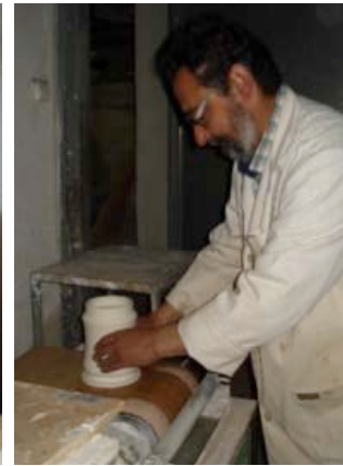
Görsel 6. Tornada ürünlerin şekillendirilmesi