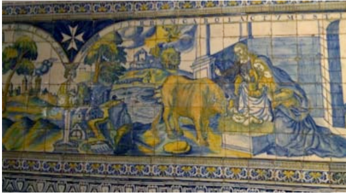
Görsel 4. Hz. Meryem'in Doğum Sahnesi, çok renkli mayolika tekniği, Talavera Pano

18.yy'da ise yalın mavi desenlerin yanı sıra çok renkli dönem yaşanırken, Avrupa'da bu dönemde karakteristik hale gelen Albarello denilen eczane kapları, kraliyet armaları ve çift başlı kartal desenli ürünler öne çıkmakla birlikte Fransız modasına uyan desenlerle Alcora etkili çanak çömlekler dönemi başlar. Bu dönem ayrıca desenlerde çelenk ve çerçevelerin başladığı dönem olmakla birlikte seramik panolar üzerinde çoğunlukla dini sahnelerin olduğu kilise duvar uygulamaları da görülmektedir.