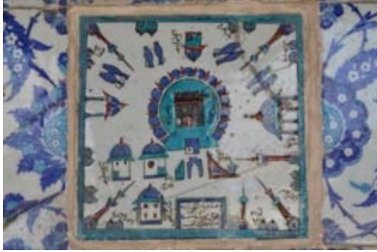
Görsel 21. İstanbul Rüstempaşa camii, son cemaat yeri, Kabe tasvirli çini

İznik üretimi ile kıyaslandığında daha düşük kaliteli üretim geleneğini sürdüren Kütahya, 17. ve 18. yy'da Kâbe ve Medine tasvirli çinilerle dikkat çeker. İstanbul Rüstempaşa Cami'nde örneği bulunan bu çinilerde Kâbe, mavi ve turkuaz renkte anahtar deliği formunda bir çerçeve içine alınarak tasvir edilir. Ayrıca Ermeni ustaların Hristiyan inancını yansıtan sembollerle süslü ürünleri 18. yy. Kütahya çini sanatının belki de en ilginç özellikleri arasındadır.