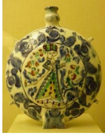
Görsel 32. Kadın figürlü tabak 18. Yy. Kütahya, Pera Müzesi ( http://www.ceramopolis.com/?attachment_id=2139 )