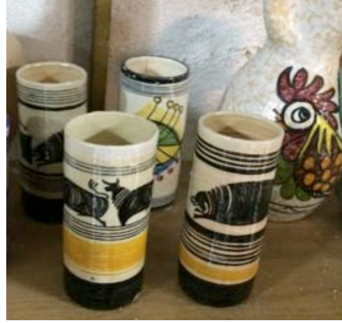
Görsel 17. Picasso'ya ait orijinal baskı