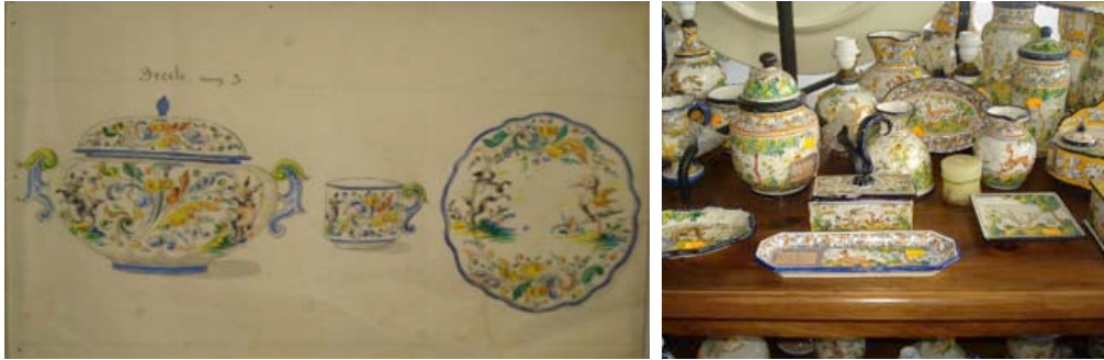
Görsel 15. El Carmen atölyesi çok renkli desen arşivi Görsel 16. Çok renkli manzara ve hayvan figürü dekorlu ürünler Fotoğraf: Ezgi Martinez, El Carmen Atölyesi, Talavera, İspanya, 2016

Mayolika tekniği ile üretilmiş tüm ürünlerde el dekorları önemli ve öncelikli unsurdur. El işçiliğin fazla olması, pazar için ürün fiyatlarının yüksek olmasına neden olmaktadır. Ticari ürünlerde 19. yy. desenleri ve çok renklilik tercih edilerek üretilen reproduksiyonlar piyasada tercih edilmektedir.