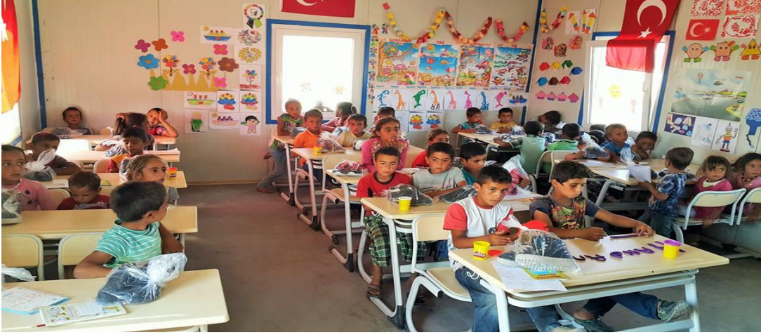
Görsel 2.3. Göç Okulu 2015 tarihli mevsimlik tarım işçi çocukları konteyner eğitimi

Proje kapsamında, birçok kamu kurum ve kuruluşların destekleriyle mevsimlik tarım işçisi ailelere yardımlar ulaştırılmıştır. Uzun soluklu eğitimler verilmiştir. Projenin amacına ulaştığını gösteren en temel nokta ise; göç okulunda eğitim gören mevsimlik tarım işçisi bir kız çocuğunun Birleşmiş Milletler tarafından eğitim hayatı boyunca masraflarının karşılanması sağlanmıştır. 9