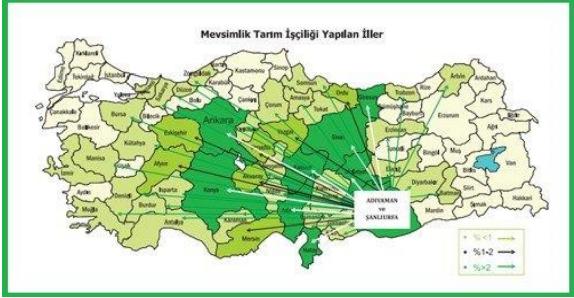
Görsel 2.1. Türkiye’de MİT’lerin çalıştıkları iller.

Mevsimlik tarım işçiliği göçü, hemen hemen Türkiye’nin her yerinde ve yılın her ayında gerçekleşmektedir. Bitkisel üretim süreçlerine bakıldığında göç genellikle çapalama ve hasat dönemlerinde yoğunlaşmaktadır. Resmi kayıtlara göre 350 bin kişi bitkisel üretim amacıyla mevsimlik göç sürecine katılmaktadır. Bu veriler, işçilerin göç sürecinde valilik ve jandarmaya yaptıkları kimlik bildirimine göre hesaplanmıştır (Kalkınma Atölyesi, 2014, s. 50- 51). Ancak, yapılan birçok alan ve saha çalışmalarında mevsimlik işçilerin sayılarına dair kesin bir bilgi mevcut değildir. Bununla birlikte sürekli hareket halinde olmaları ve bir bölgeden başka bölgelere yapılan kısa dönemli göçler etkili olmaktadır.