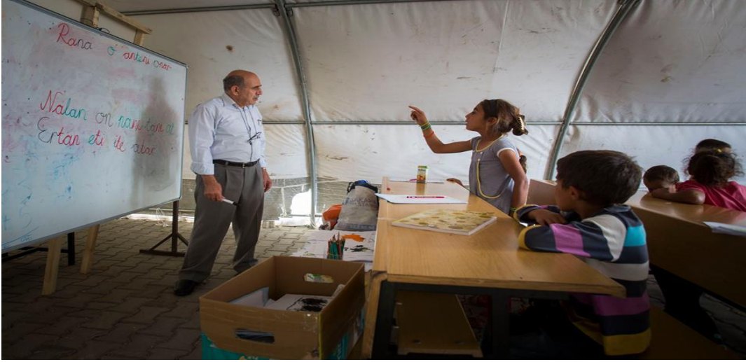
Görsel 2.2. Göç Okulu Projesi 2014 tarihli eğitim çadırı Eskişehir Alpu İlçesi

Göç Okulu projesi ulusal ve yerel basın organlarında oldukça geniş yer almıştır. Bunlardan biri de 2015 yılında proje protokolünün yenilendiği tarihi içeren haberle ilgilidir. 8