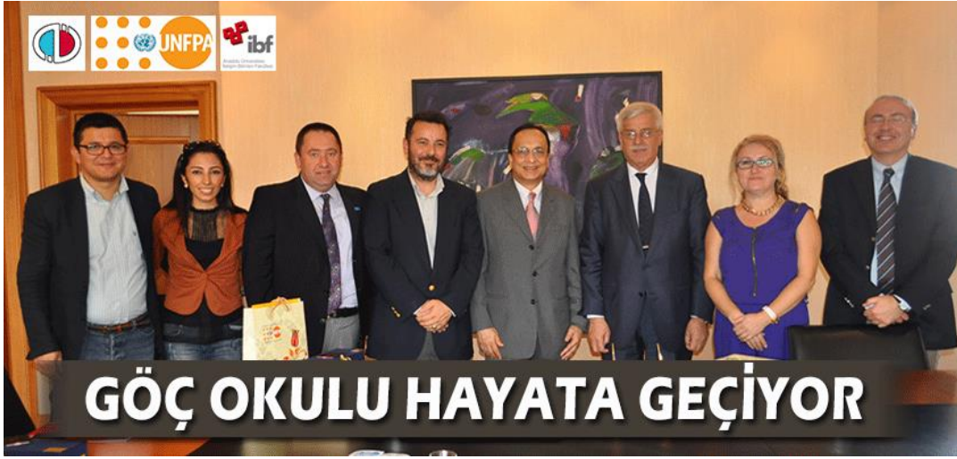
Görsel 1.2. Göç Okulu Projesi 2013 tarihli protokol imzalama töreni

Proje kapsamında, her yıl Güneydoğu Anadolu Bölgesi'nden Eskişehir'e gelen, sayıları yerleşim yerlerine göre 1 ila 5 bin arasında değişen mevsimlik tarım işçilerinin sosyal, ekonomik, kültürel ve sağlık gibi temel ihtiyaçların giderilmesine dönük çalışmalar yürütülmüştür. Temel olarak; mevsimlik tarım işçilerinin medyada görünürlüğünün sağlanması, farkındalığının artırılması ve savunuculuk çalışmalarının yapılmasını hedeflemiştir. 2014 yılında Anadolu Üniversitesi'nin projeye hibe ettiği 2 adet eğitim çadırı sayesinde mevsimlik tarım işçi çocuklarına eğitimler verilmiştir. Projenin, ilk imzalama töreni Görsel 2.2'de görülmektedir.