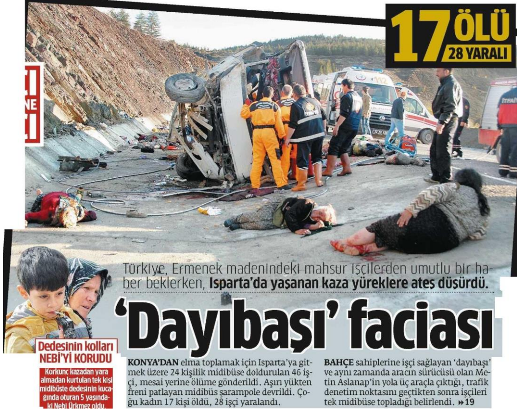
Görsel 2.6. Star gazetesı 1 Kasım 2014 tarihli haberi

Konuyla ilgili olarak bir sonraki bölümde basılı medyanın mevsimlik tarım işçileri nasıl sunduğuyla ilgili veriler detaylı olarak paylaşılmıştır.