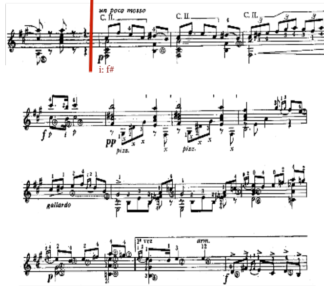
Görsel 9. Federico Moreno Torroba'nın Sonatina isimli eserinin ilk bölümü - yardımcı tema