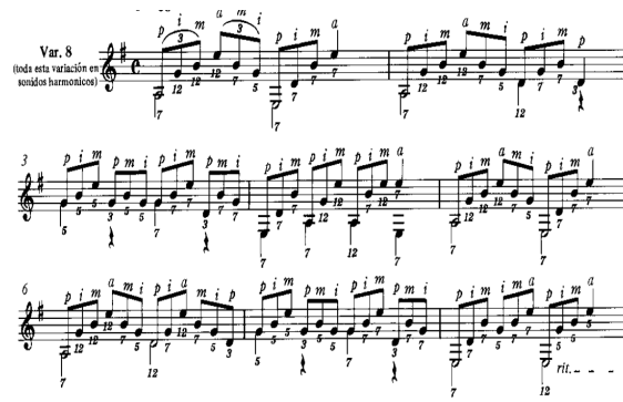
Görsel 6. Miguel Llobet'in Fernando Sor'un Teması Üzerine Varyasyonlar adlı eserinin 8. varyasyonu