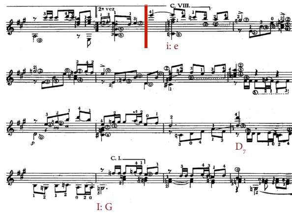
Görsel 10. Federico Moreno Torroba'nın Sonatina İsimli Eserinin İlk Bölümü - Gelişme Bölümü