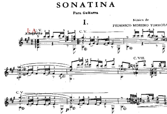
Görsel 8. Federico Moreno Torroba'nın Sonatina isimli eserinin ilk bölümü - ana tema

Görsel 8, 9 ve 10’da bestecinin gitar için yazdığı Sonatina adlı üç bölümlü sonat formundaki eserinin sonat allegrosu özelliğindeki ilk bölümü görülmektedir. 14. görselde eserin ana teması, 15. görselde yardımcı tema ve 16. görselde gelişme bölümü sergilenmektedir. Klasik bir sonat allegrosu olarak, ana tema La majörde, yardımcı tema ise La majörün ilgili minörü olan Fa# minörde verilmiştir. Eserin gelişme bölümünde, tematik yapı La Majörün ilgili dominantı olan Mi Majör yerine, Mi minörde verilmiş ve Re dominant 7’li akoruyla Sol Majöre yönelmiştir. Ana tonun 7. derecesi olan ve oldukça uzak sayılabilecek Sol sesine yapılan bu yönelim, eserin yazıldığı dönem öncesindeki eserlerde karşılaşılmayan bir özellik olarak ortaya çıkmaktadır.