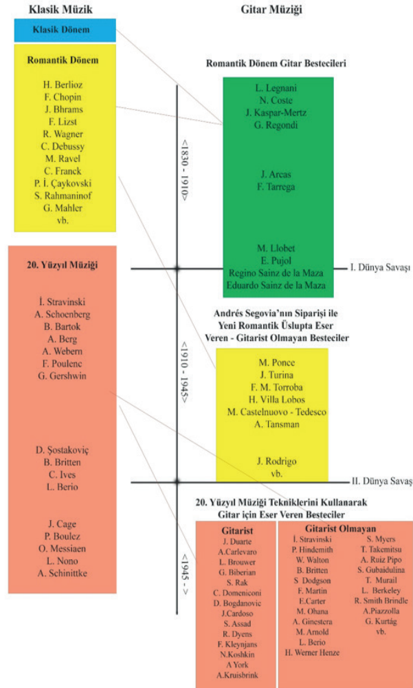
Tablo 1. Klasik müziğin ve gitar müziğinin tarihsel süreçteki etkileşimleri

Tablo 1'de klasik müziğin ve gitar müziğinin tarihsel gelişiminde rol alan bazı önemli bestecilere değinilerek, bu iki müzik olgusunun birbiriyle etkileşimi ve gitar müziğinin geçirmiş oldu-