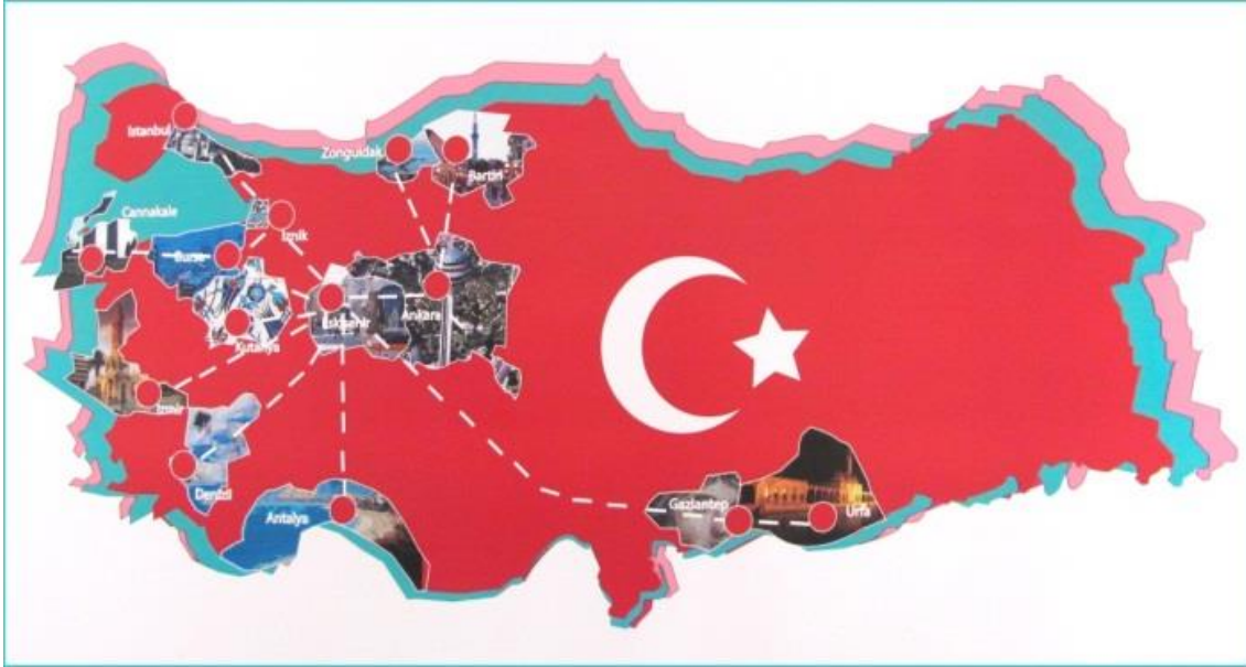
Resim 1. E1-‘Türkiye İzlenimleri’

Öğrencilerden E1 ‘Türkiye İzlenimleri’ isimli tasarımına (Resim 1) ilişkin görüşlerini şu şekilde ifade etmektedir: