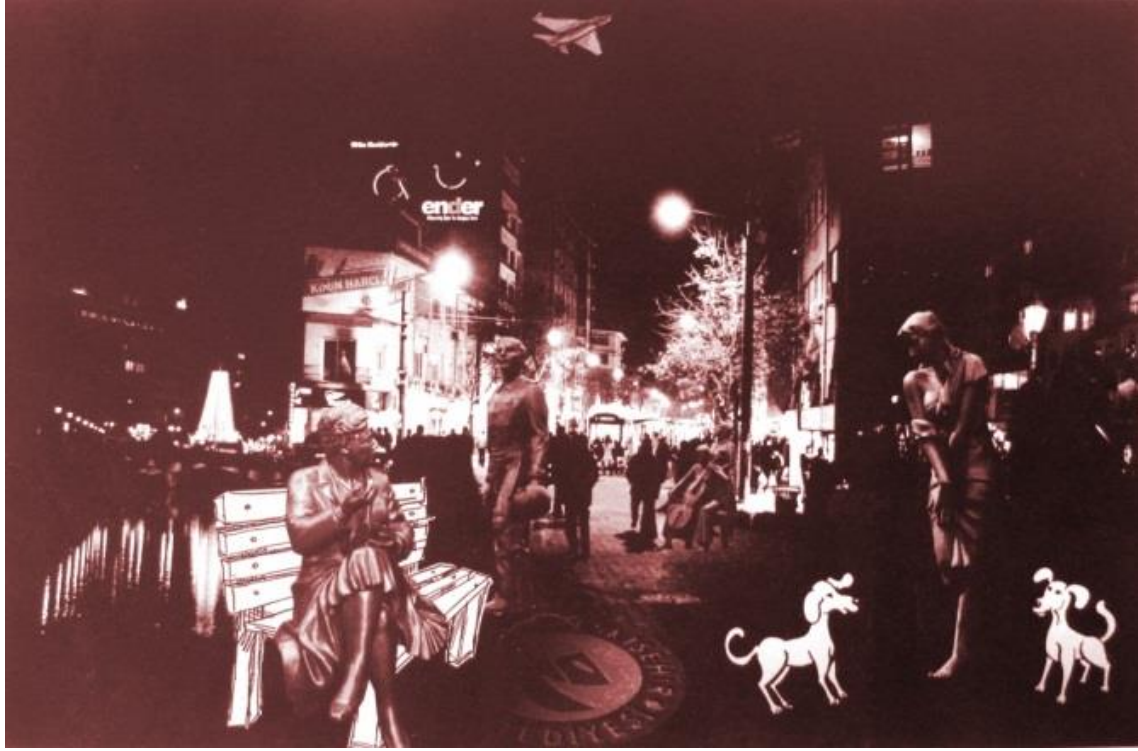
Resim 4. E3-‘Eskişehir’

mümkün, çini sanatı ve çini sanatına ait sembolik dil çerçevesinde şekillendi' olarak ifade etmektedir. Öğrencilerden E3 gerçekleştirdiği bir diğer tasarım çalışmasında ise Eskişehir'e ait şehir kültürünü bir takım semboller (Heykeller, jet uçağı,, doktorlar caddesi, Porsuk çayı vb.) çerçevesinde anlatmıştır (Resim 4).