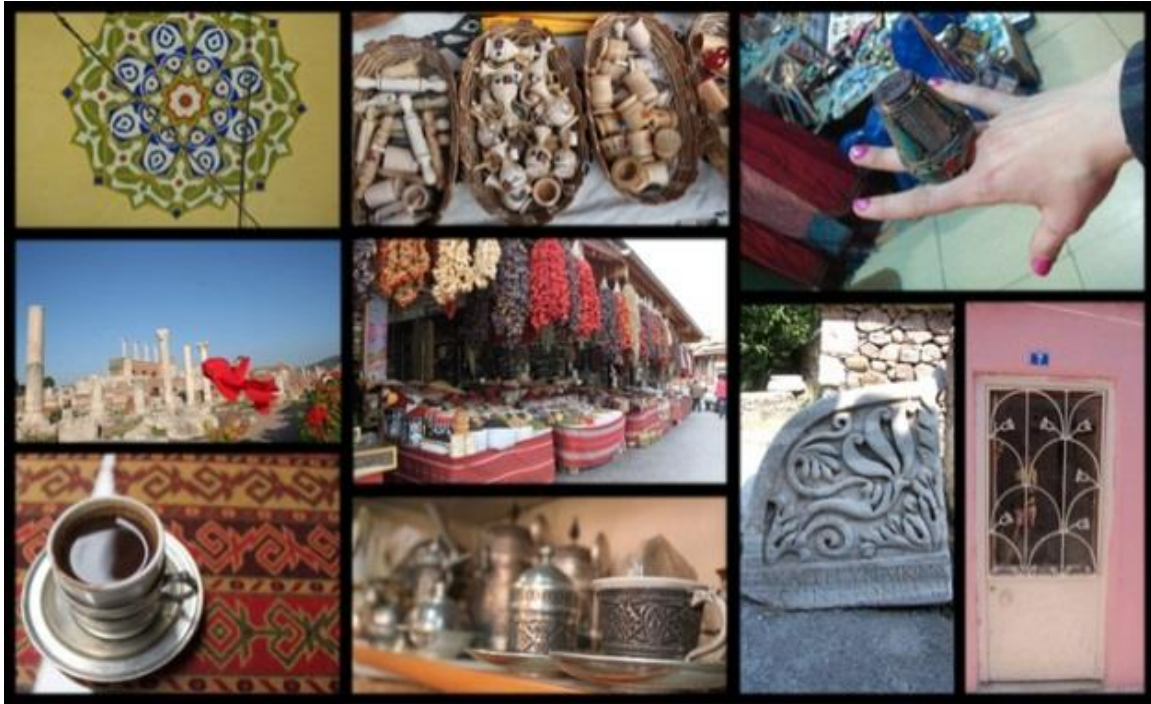
Resim 5. E4-‘Geleneksel İmajlar’