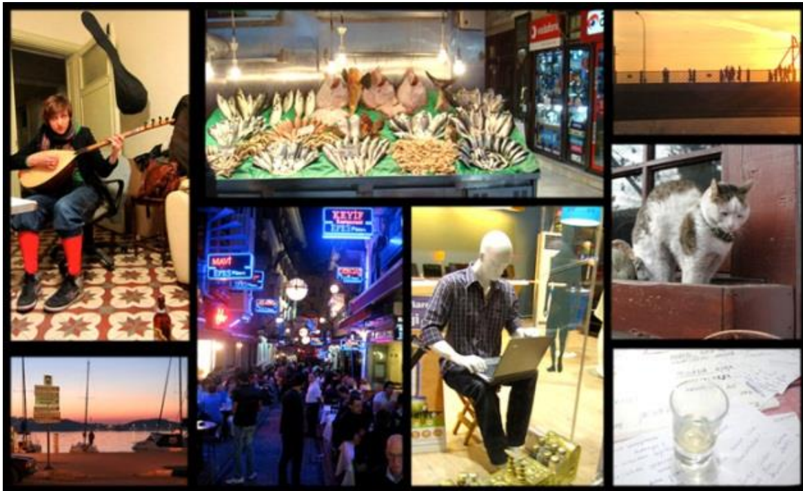
Resim 6. E4- ‘Sokaktan Görüntüler’