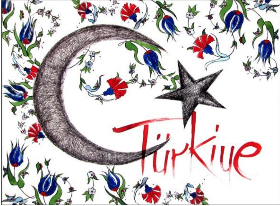
Resim 2. E2. 'Türk Motifleri'

Öğrencilerden E2, 'Türk Motifleri' isimli tasarımını (Resim 2) gerçekleştirirken kendisini etkileyen noktaları şu şekilde ifade etmektedir: