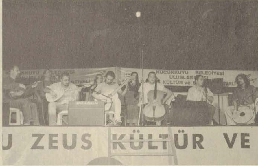
Festivalde üniversitemiz Anadolu Ezgileri Topluluğu da bir konser verdi.