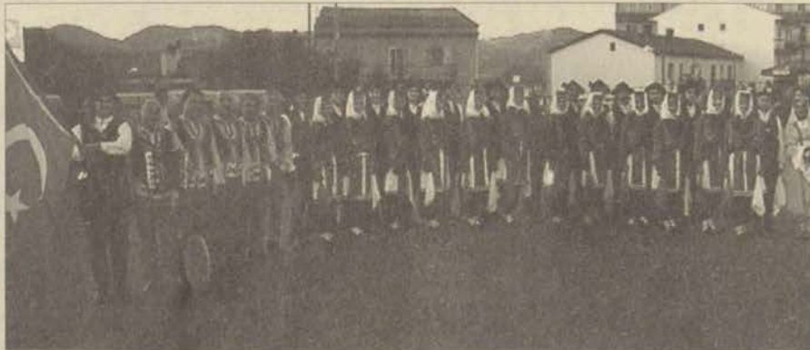
Pek çok başarılı gösteriye imza atan Halk Dansları Topluluğumuz İtalya'da da büyük ilgi gördü.