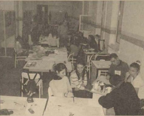
Çalışmanın ilk aşaması tamamlandı ve devam edecek öğrenciler belirlendi.

Moda Tasarımı ve Endüstriyel Tasarım Bölümü öğrencileri, bir çanta firmasının isteği üzerine okul, seyahat ve sırt çantalarının tasarımını yapıyorlar. Projenin ilk aşaması tamamlandı ve ikinci aşamaya geçecek öğrenciler belirlendi.