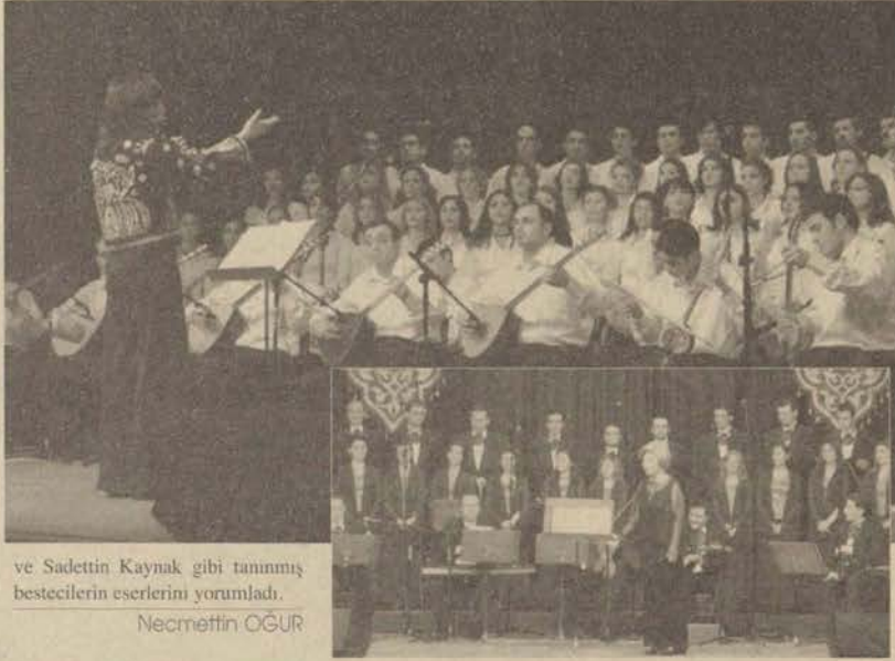
ve Sadettin Kaynak gibi tanınmış bestecilerin eserlerini yorumladı.