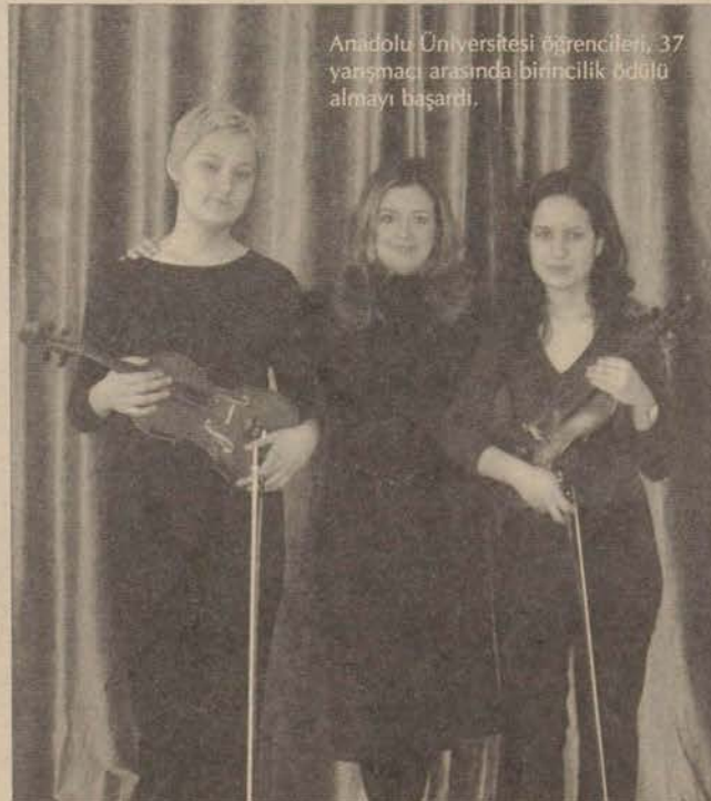
Anadolu Üniversitesi öğrencileri, 37 yarışmacı arasında birincilik ödülü almayı başardı.