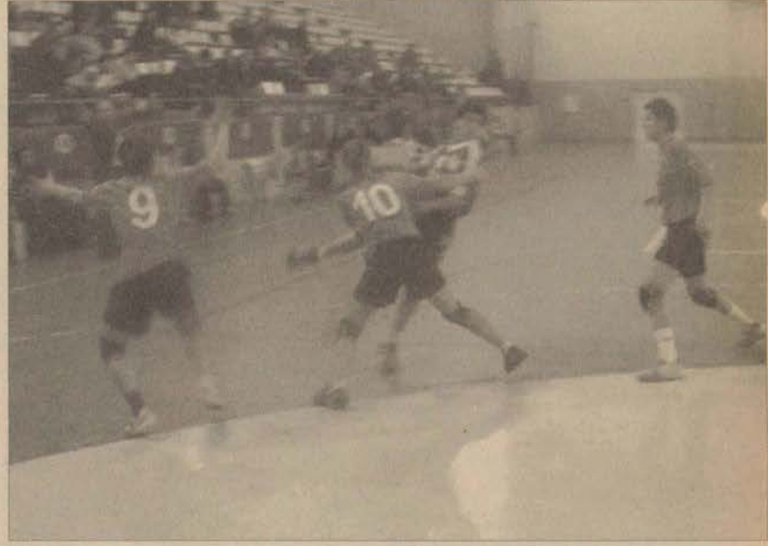
Fransız ekibini Eskişehir'de 12 sayı farklı mağlup eden bayan hentbolcularımız, deplasmanda bu avantajını korumayı bildi ve çeyrek finale yükseldi.