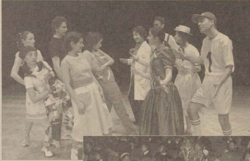
Tiyatro Anadolu, oyunu 7-12 yaş arasındaki çocuklar için sahnelenmeye devam edecek.

7-12 yaş arası izleyicilerin ilgiyle ve keyifle seyrettikleri oyuna küçük izleyiciler büyük ilgi gösterdi. Oyun, Cuma günleri saat 11.00 ve 13.00'de Yunus Emre Kampüsü Atatürk Kültür ve Sanat Merkezi Oda Tiyatrosu, Cumartesi günleri ise yine saat 11.00 ve 13.00'de Yunus Emre Kültür Merkezi Tiyatro Salonu'nda minik seyircilerin beğenisine sunulacak.