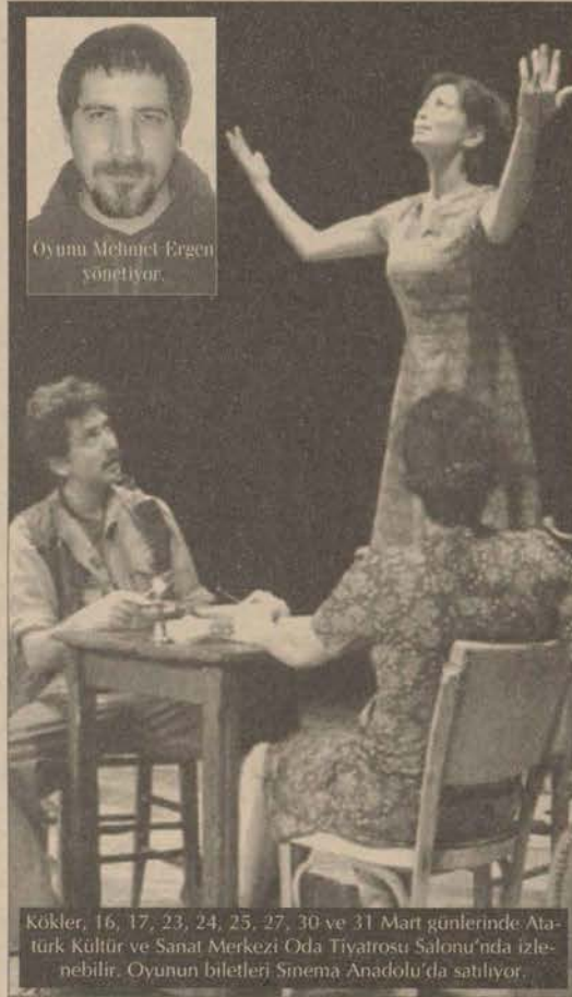
Kökler, 16, 17, 23, 24, 25, 27, 30 ve 31 Mart günlerinde Atatürk Kültür ve Sanat Merkezi Oda Tiyatrosu Salonu'nda izlenebilir. Oyunun biletleri Sinema Anadolu'da satılıyor.