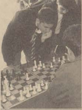
Öğrenci kulüpleri de açtıkları standlarda çalışmalarını hakkında konuk öğrencilere bilgiler verdiler

Anadolu Üniversitesi'nin her yıl üniversite adaylarına yönelik olarak düzenlediği geleneksel tanıtım programının yedincisi, Türkiye'nin çeşitli illerinden katılan liseli öğrencilerle renkli görüntülere sahne oldu.