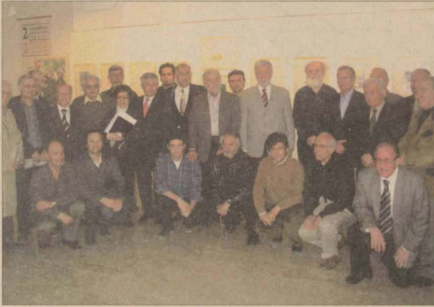
Anadolu Üniversitesi'nin ikinci uluslararası karikatür sergisinin açılışına pek çok sanatçı katıldı.