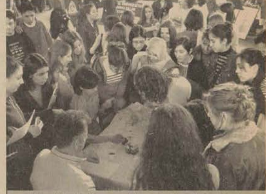
Eğitim birimlerinin yaptıkları uygulamalar üniversite adaylarının büyük ilgisini çekti.