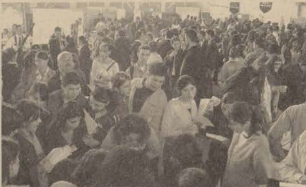
Yunussemre Kampüsü Spor Salonu yine en kalabalık günlerinden birini yaşadı.

E skişehir ve çevre illerdeki lise öğrencilerine Anadolu Üniversitesi'ni yakından tanıtmak amacıyla her yıl düzenlenen etkinlik, 8 Nisan günü yapıldı. "Anadolu Üniversitesi'nde Buluşalım" adı altında Yunussemre Kampüsü Spor Salonu'nda gerçekleştirilen tanıtım programına Eskişehir'in yanı sıra Bursa, Kütahya, Ankara, Bilecik ve Bozüyük'ten çeşitli lise