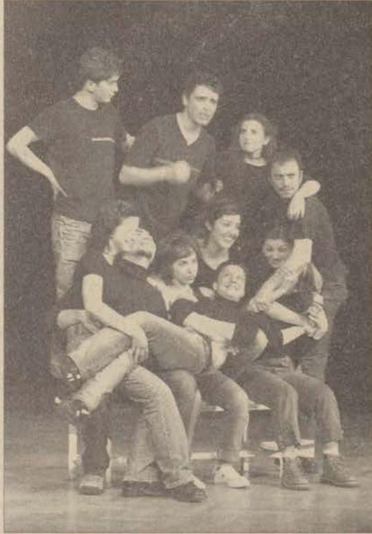
Devlet Konservatuvarı öğrencileri sergiledikleri iki ayrı oyunda Dünya Tiyatrolar Günü'nü kutladılar.