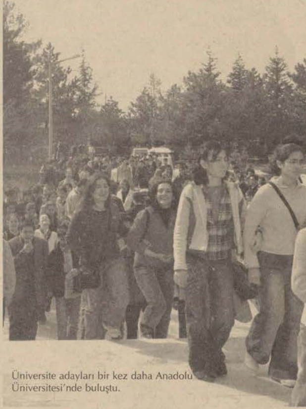
Üniversite adayları bir kez daha Anadolu Üniversitesi'nde buluştu.