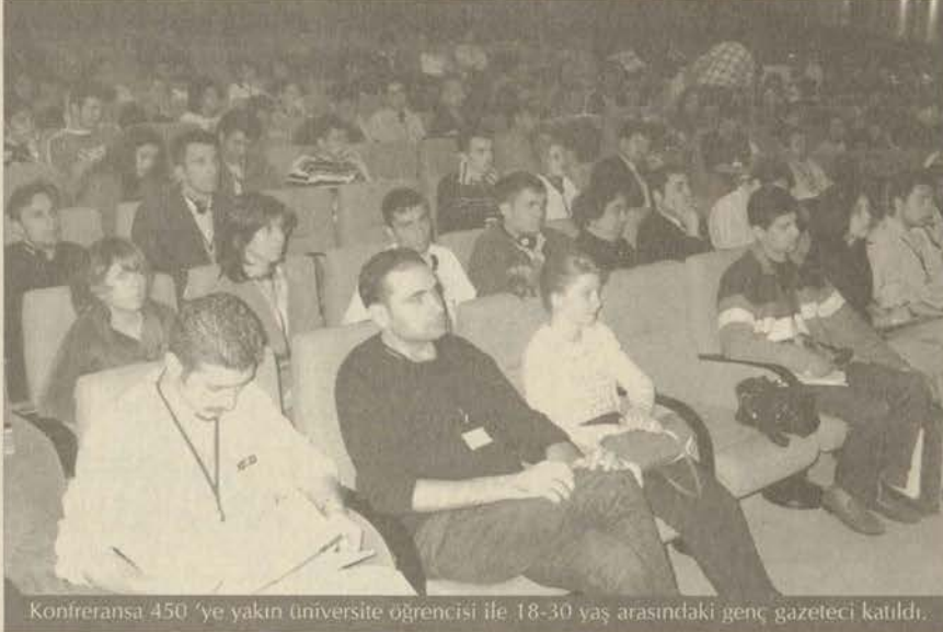
Konferansa 450 'ye yakın üniversite öğrencisi ile 18-30 yaş arasındaki genç gazeteci katıldı.

Arı Hareketi'nin Ankara'da düzenlediği konferansa, 450 'ye yakın üniversite öğrencisi ile genç gazeteci katıldı. Konferansta, İletişim Bilimleri Fakültesi öğrencileri ile Anadolu Haber de yer aldı.