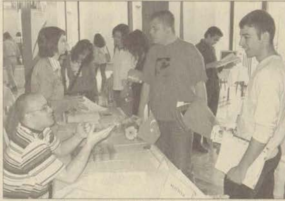
Anadolu Üniversitesi öğrencileri Kariyer Günleri'ne büyük ilgi gösterdi. Etkinliğe Osmangazi Üniversitesi öğrencileri de katıldı.