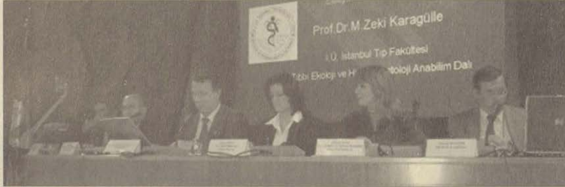
TOIYO'nun düzenlediği panellerde Türkiye turizmi bütün yönleriyle ele alındı.