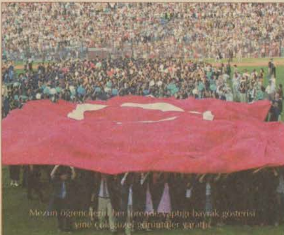
Mezun öğrencilerin bir törende yaptıkları bayrak gösterisi yine çok güzel görüntüler yarattı.