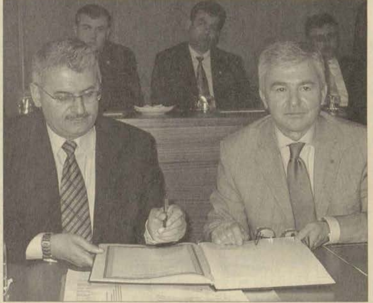
Ulaştırma Bakanı Binali Yıldırım, ziyaretinde Anadolu Üniversitesi Şeref Defteri'ni de imzaladı.