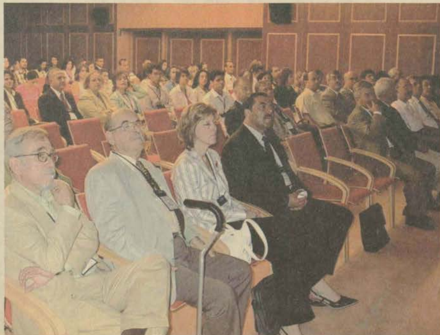
AÜBİBAM'ın düzenlediği 5. Ulusal Kromatografi Kongresi Kongre Merkezi Salonu'nda yapıldı.