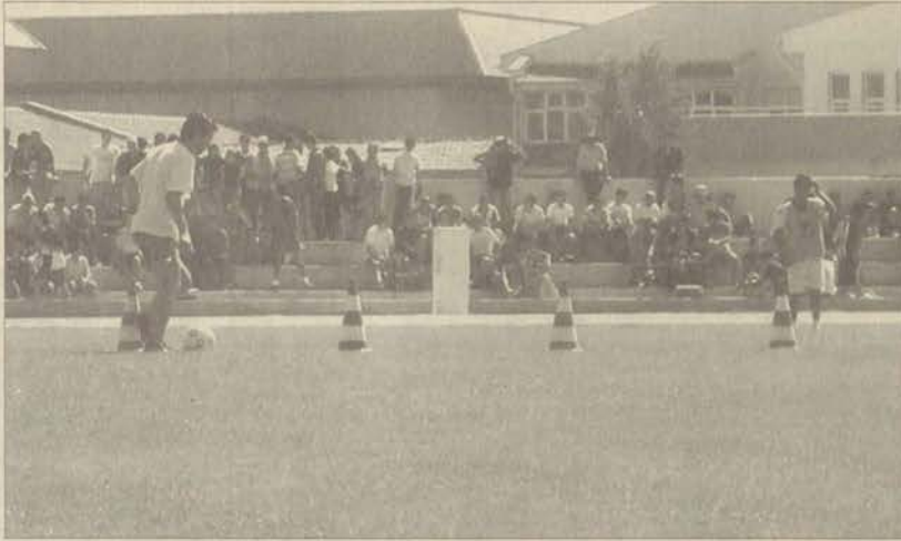
BESYO öğrencisi olabilmek için iki gün boyunca yarışan adayların popüler branşı futbol oldu.