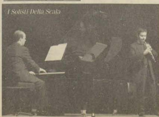
I Solisti della Scala