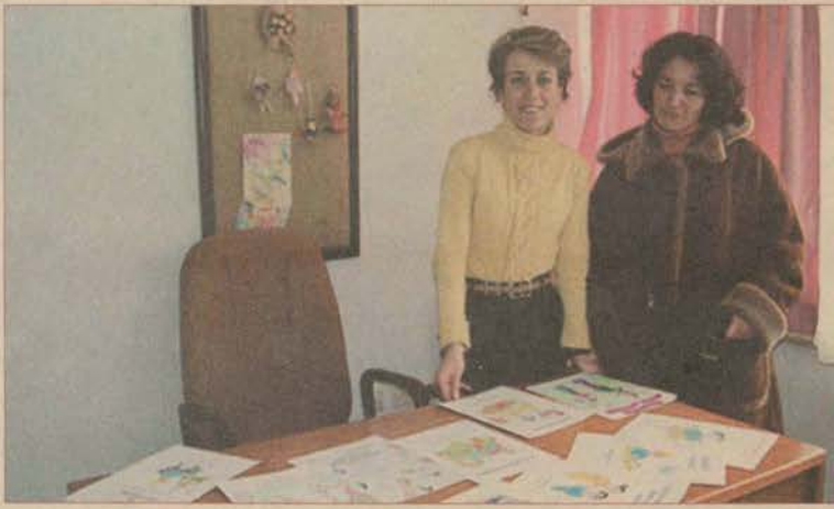
Yazılan 14 kitap, piyasada bu alandaki boşluğu doldurmayı amaçlıyor.

Öykü yazımına 2002 yılının Haziran ayında başladığını anlatan Vuran, çalışmaya Eğitim Fakültesi, Özel Eğitim ve