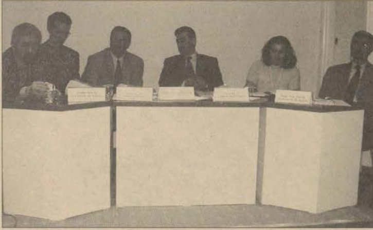
Konuşmacılar, sporda şiddetin önlenmesi için uzmanlarla işbirliği yapılmasını istediler.