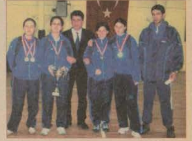
Bayan masa tenisi takımımız, Türkiye Kupası'nın sahibi oldu.