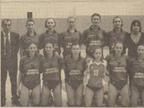
Bayan voleybolcularımız ligde gösterdikleri başarıyı birinci lige çıkararak perçinlemek istiyor.

Takımımızın antrenörü Şahin Çatma "Ligi istediğimiz bir durumda bitirdik. Play-Off mücadelelerinde de aynı başarıyı gösterip, Süper lige çıkmak istiyoruz. Tüm oyuncularımı tebrik ediyorum" dedi.