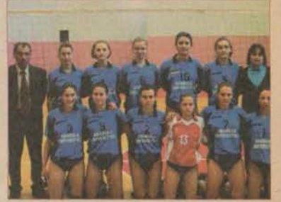
Türkiye Bayanlar A2 Ligi'ni ikinci sırada bitiren bayan voleybolcuların hedefi şampiyon olarak birinci lige yükselmek