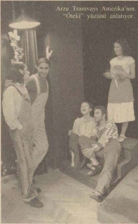
Arzu Tramvayı Amerika'nın "öteki" yüzünü anlatıyor.

Tennessee Williams'ın ünlü oyunu, Konservatuvar öğrencileri tarafından sahneleniyor.