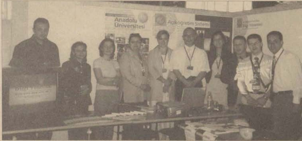
Açıköğretim Fakültesi, etkinlik çerçevesinde bir de stand açtı.

Açıköğretim Fakültesi, 28-30 Mayıs günleri arasında Doğu Akdeniz Üniversitesi'nin düzenlediği 3. Uluslararası Eğitim Teknolojileri Sempozyumu ve Fuarı'na katıldı.