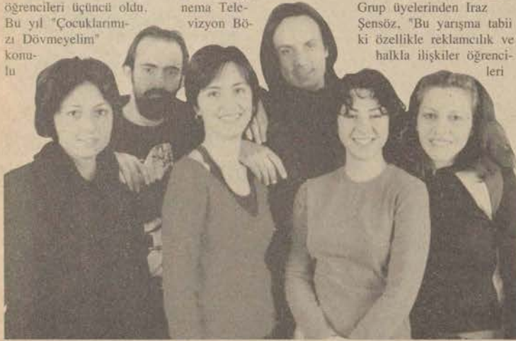
VOLTRON grubu IAA yarışmasında üçüncü oldu