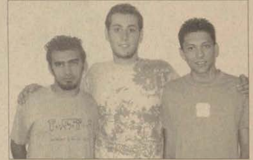
NAPA-JANS Boğaziçi Üniversitesi'nin düzenlediği yarışmada ikinciliği elde etti.