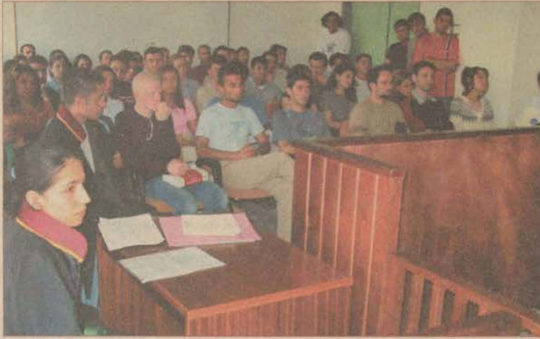
Gerçek bir duruşmadaki tüm unsurlar kurgusal duruşmada da yer aldı.