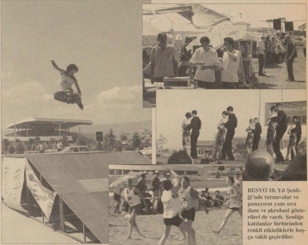
BESYO 10. Yıl Şenliği'nde turnuvalar ve panayırın yanı sıra dans ve akrobasi gösterileri de vardı. Şenliğe katılanlar birbirinden renkli etkinliklerle hoşça vakit geçirdiler.