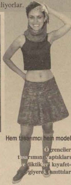
Hem tasarımcı hem model

Öğrenciler tasarımın yaptıkları ve diğtikleri kıyafet-giyere katıttılar