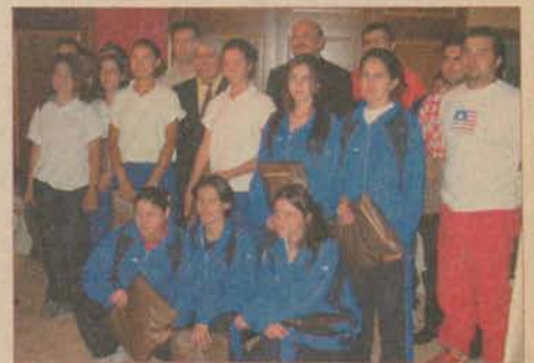
Sporcularımız, çeşitli yarışmalarda Anadolu Üniversitesi'ni ve Eskişehir'i başarıyla temsil ettiler.