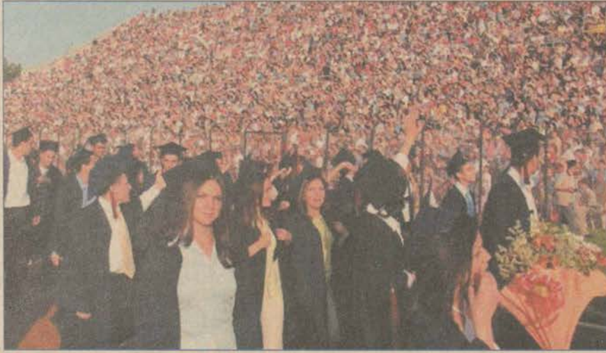
Mezuniyet töreni bir kez daha renkli görüntülere sahne olacak.

Anadolu Üniversitesi'nin 2002-2003 öğretim yılı mezunları, 29 Pazar günü Atatürk Stadyumu'nda yapılacak törenle belgelerini alacaklar.