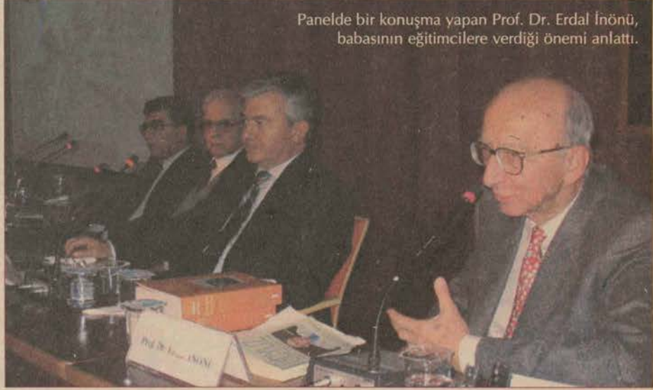
Panelde bir konuşma yapan Prof. Dr. Erdal İnönü, babasının eğitimcilere verdiği önemi anlattı.

Türkiye Cumhuriyeti'nin ikinci Cumhurbaşkanı İsmet İnönü, aramızdan ayrılışının 30. yılında üniversitemizin İsmet İnönü Vakfı ile birlikte düzenlenen bir dizi etkinlikle anıldı.