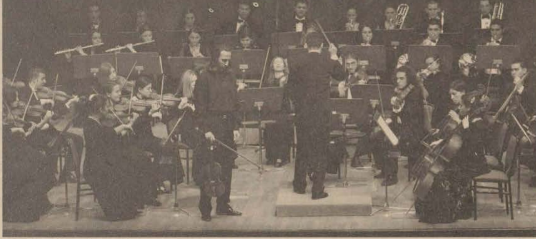
İsmet İnönü anısına gerçekleştirilen konserlerde orkestra Beethoven ve Sibelius'u yorumladı.

rumlayan Gençlik Senfoni Orkestrası 11-12 Mart 2004 tarihlerinde Atatürk Kültür ve Sanat Merkezi Opera ve Bale Salonu'nda bir konser verecek. Orkestra Eylül 2004 ayında Petersburg'ta gerçekleştirilecek Gençlik Orkestraları Festivali'ne de davet edildi.