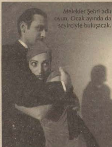
Melekler Şehri adlı oyun, Ocak ayında da seyircisiyle buluşacak.

Tiyatro Anadolu'nun, Ocak ayı içinde sahneye koyacağı bir diğer oyun ise,