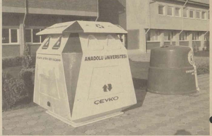
İki Eylül ve Yunussemre Kampüslerine yerleştirilen konteynerlerde 55 ton atık toplandı.

Banar, projenin devamı ile ilgili olarak da "Mevcut konteynerlerin yanına piller için