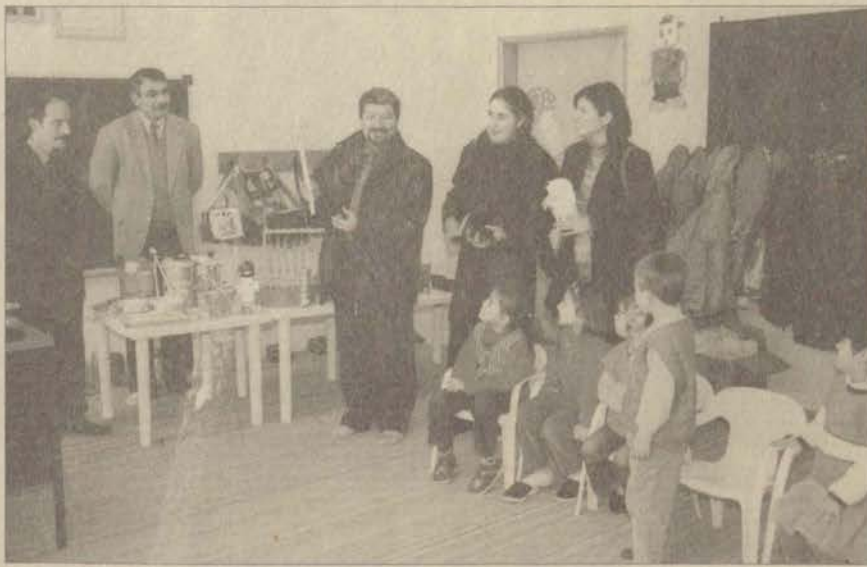
Okul Öncesi Öğretmenliği Bölümü öğrencileri yaptıkları enstrümanları küçük öğrencilere hediye ettiler.