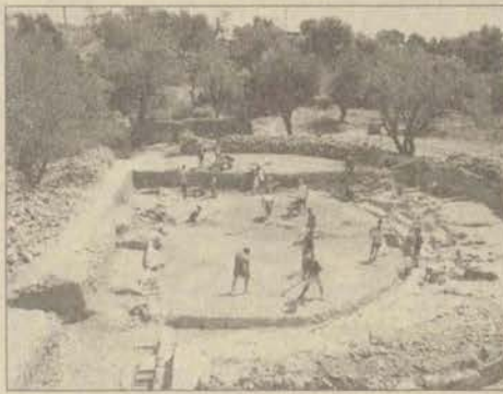
Kelenderis Antik Kenti kazı alanı