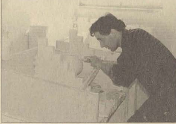
Muammer Çakı anısına düzenlenen yarışmanın başvuru koşulları belirlendi