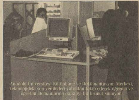
Anadolu Üniversitesi Kütüphane ve Dokümantasyon Merkezi, teknolojiye son yenilikleri yatırımdan takip ederek öğrenil ve öğretim elemanlarına daha iyi bir hizmet sunuyor