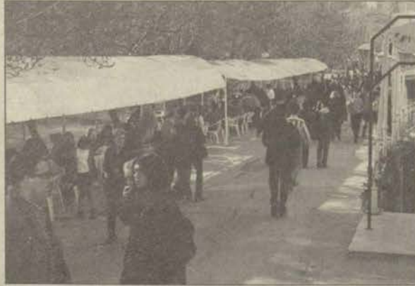
Masalar Porsuk kenarından kalkıyor

Porsuk Çayı kenarında bulunan ve kafelere ait olan masalar Büyükşehir Belediyesi tarafından kaldırıldı