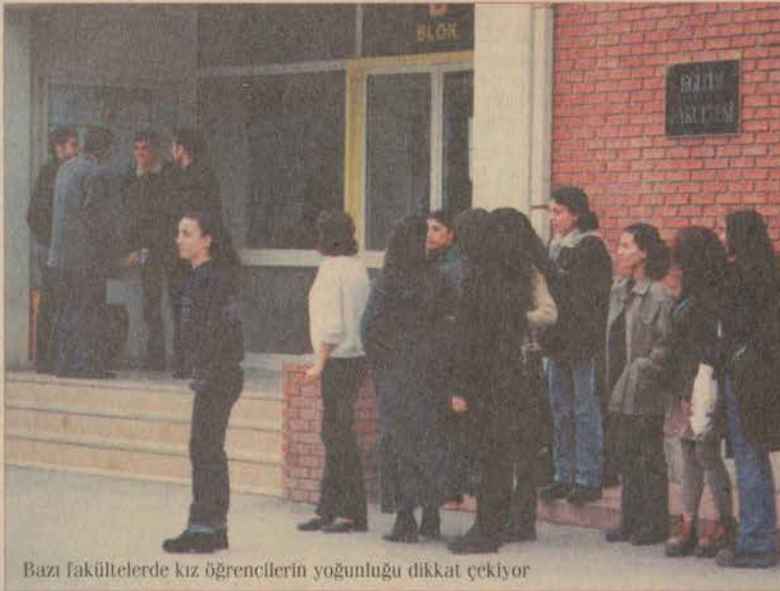
Bazı fakültelerde kız öğrencilerin yoğunluğu dikkat çekiyor

Kız öğrencilerin sayısının fazlalığı, eğitimciler ve öğrenciler tarafından sosyolojik, ekonomik ve disiplinli çalışma olgularına dayandırılıyor.