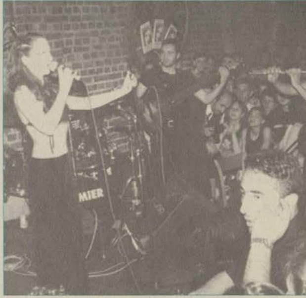
Eskişehirliyle ilk kez buluşan Sertab Erener, yaklaşık iki saat süreyle aralıksız sahnede kalarak izleyenleri performansına hayran bıraktı. Sempatik tavırları ile dikkat çeken Erener, Eskişehir'e tekrar gelmek üzere söz verdi.

S ertab Erener, Eskişehir'de unutulmaz bir konser verdi. Türkiye'nin en iyi sopranolarından biri olarak kabul edilen Sertab Erener, 16 Haziran akşamı Hayal Kahvesi'nde muhteşem bir konser verdi.