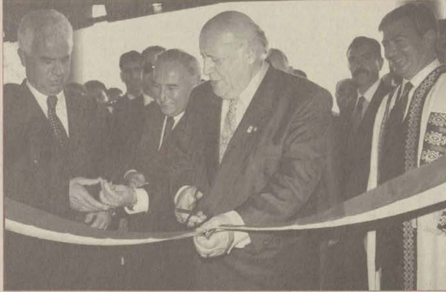
Açıköğretim Binası, Cumhurbaşkanı Süleyman Demirel tarafından hizmete açıldı. Açılış töreninde KKTC Başbakanı Derviş Eroğlu, Milli Eğitim Bakanı Metin Bostancıoğlu, YÖK Başkanı Kemal Gürüz, Vali Ali Fuat Güven de katıldı.

Özellikle iletişim devriminden sonra Türkiye'de Açıköğretimle beraber bir eğitim devriminin