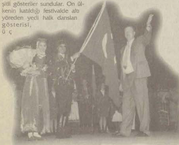
Belçika ve Hollanda'ya giden Halkdansları Topluluğu yaptığı gösterilerle büyük beğeni topladı.