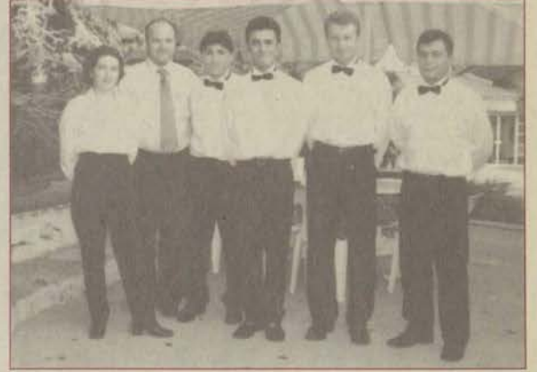
Gülyüzlü ve ilkel hizmet anlayışla çalışan Misafirhane personeli, üniversitemiz çalışanlarına ve misafirlerine en iyi hizmeti sunuyor.