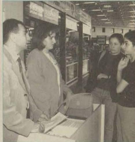
Tren Gari ve Otobüs Terminali'nde yeni öğrencilerimiz için kayıt büroları hizmet veriyor

Farklı bir şehirden gelip Eskişehir'e "merhaba" diyen gençleri Anadolu Üniversitesi ilk adımlarında karşılıyor.