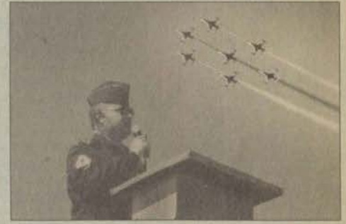
Türk Yıldızları İnönü Zaferi Kutlamalarında izleyicileri büyüledi.