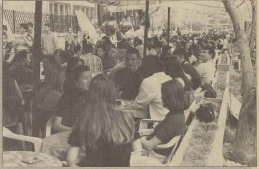
Kurban Bayramı dolayısıyla Eskişehir'e gelen öğrenciler Porsuk kenarındaki kafeteryaları doldurdu

Farklı şehirlerde okuyan öğrencilerin birbirleri ile görüşme imkanı buldukları bayram tatili, sınavlardan önce pek çok öğrenciye iyi bir moral kaynağı oldu. Bayramın ilk gününden itibaren kente yakın olan sıcak hava, adeta baharın habercisi gibiydi. Eskişehirli gençler her bayramda olduğu gibi yine kente