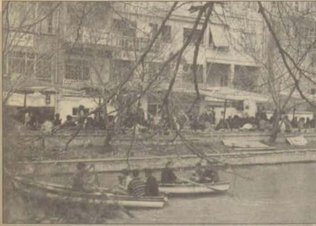
Bayramda bazı Eskişehirliler güzel havanın tadını sandallarda çıkarttılar.

Bütün bunların yanı sıra, geçmişten bu güne süre gelen bayram gelenekleri de devam ettirildi. Her Kurban Bayramı'nda olduğu gibi bu bayram da çeşitli kuruluşlara yardım yapılırken, kurban etleri de ihtiyacı olan insanlara dağıldı. Bayram namazı kılındı, kurbanlar kesildi ve aile içi bayramlaşmaları, komşu ve eş-dost ziyaretleri izledi.