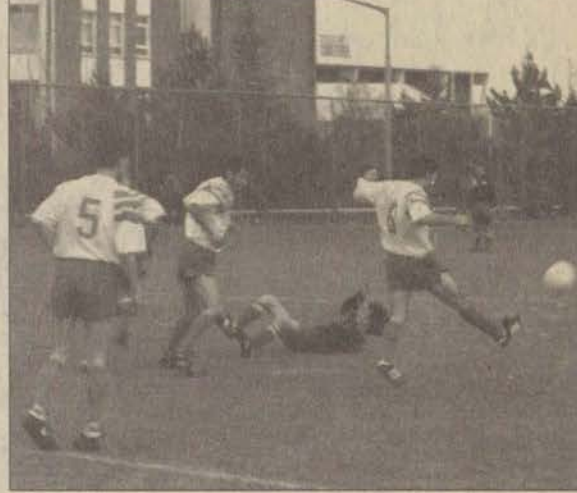
İki ekibin mücadelesinde gülen taraf Güzel Sanatlar Fakültesi oldu.