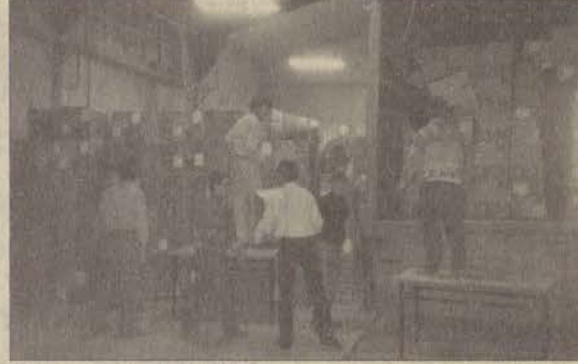
Her öğretim üyesine bir bilgisayar projesi kapsamında alınan 550 adet bilgisayar üniversitemiz depolarına geldi.

Özkazanç proje ile ilgili alt yapı çalışmalarının sürdüğünü belirterek, "İdealimiz her kişiye bir bilgisayar alınmasıdır" diye konuştu.