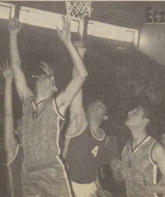
İkinci yarıyı nefes kesen maçta gülen taraf Eczacılık Fakültesi oldu.

tiği şampiyonada Anadolu Üniversitesi sırasıyla Dicle, 18 Mart ve Atatürk Üniversitelerini yenip grup birincisi oldu. Finalde Bilgi Üniversitesi'ne yenilen Ana.Ü. bu yenilgiye rağmen ikinci sırada yer alarak Üniversiteler Türkiye 1. Basketbol Ligi'ne yükseldi.