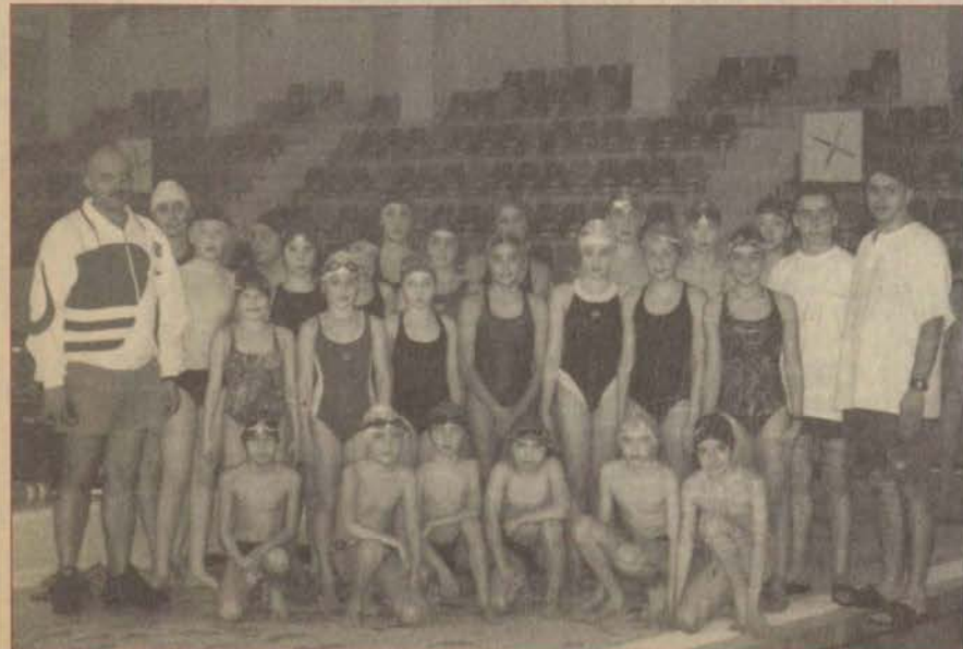
Yüzme havuzunda çeşitli yaş gruplarında sporcular yetiştiriliyor.