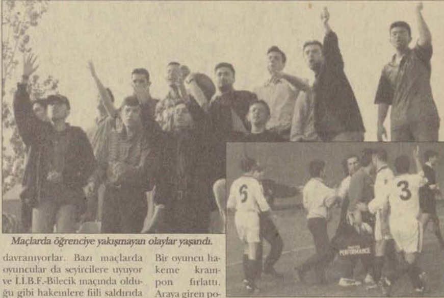
Maçlarda öğrenciye yakışmayan olaylar yaşandı.

Hakemler maçlarda, her ne kadar amatör bir mücadele de olsa, kuralları uygulamak için çaba gösteriyorlar. Her hakemin yaptığı gibi onlar da hata yapıyorlar. Ama maçları iyi niyetle, karşılaşmaların belli kuralları çerçevesinde yürütülmesini sağlayarak, idare ediyorlar. Fakülte-lerin öğrencileri de kendi takımlarını desteklemek için, tribünlerdeki yerlerini alıyorlar. Maç ilerledikçe seyirciler bu maçın bir eğlence olduğunu unutup, hakemlere son derece kaba ve ağır hakaretler içeren sözler sarfediyorlar. Bir üniversite öğrencisinden çok, cahil bir insan gibi