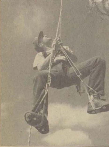
ESMAG üyesi bir mağara çıkışında

ESMAG üyeleri gerçekleştirdikleri çalışmalarda yeraltının büyüleyici görüntüleri ile tanışıyorlar