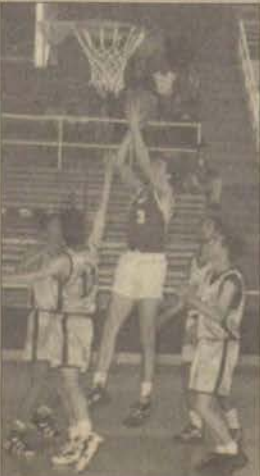
Eczacılık Fakültesi Bilecik Karşısında zorlanmadı

19 sayı ile Aykut olurken, Emrah 14, Alper 8, Volkan 7, Deniz 2 sayı kaydettiler. Bilecik'te ise Kaptan Süleyman 12 sayı ile takımını avakta tutan tek isim olurken, ikinci yarıda 10 sayı üreten Özgür de dikkat çeken bir diğer isim oldu. Diğer oyuncularından Mustafa 9, Murat Akgül ise 4 sayı kaydettiler.