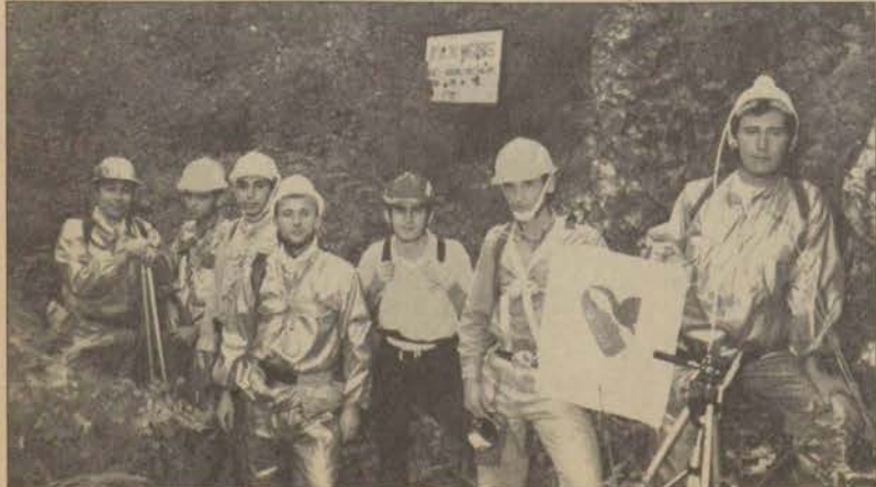
ESMAG üyeleri mağaraya girmeden önce