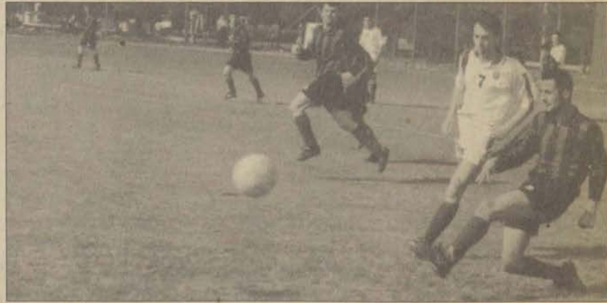
İ.L.B.F. ile Bilecik Meslek Yüksekokulu arasında oynanan maçtan bir estantane