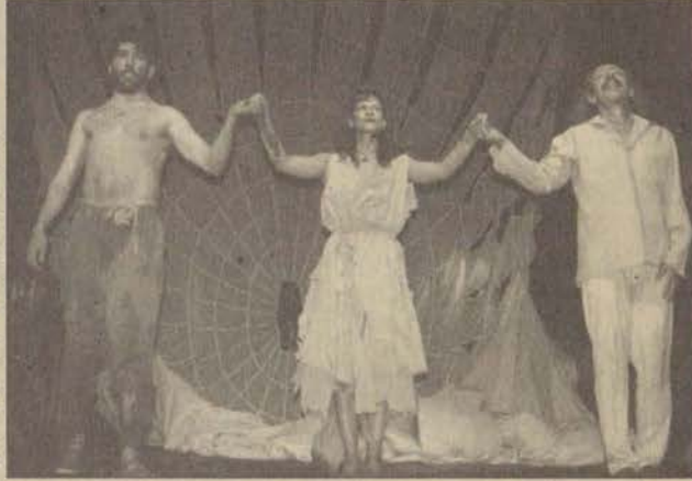
Dostlar Tiyatrosu Oyuncuları oyun sonunda seyircileri selamlarken

Simyacı eseri (kitabı) içinde Mevlana'dan öğeler taşıması