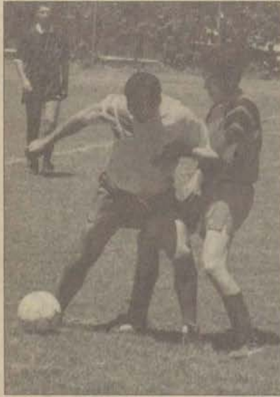
Eczacılık-G.S.F. karşılaşması berabere sona erdi.(2-2)

1998 Fakülte/Yükseköğuller Kupası Eleme Grubu maçları sonunda Devlet Konservatuarı-Eczacılık finalde oynamaya hak kazandılar.Ancak A.ö.F.'nin itirazı sonucu final karşılaşması ertelendi. Kesin karar önümüzdeki hafta toplanacak Spor Birliği toplantısından sonra belli olacak.