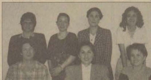
Kullanılmayan eşyaları panayırda satmayı planlayan komisyon üyeleri öğrenciler için bir fon oluşturmaya çalışıyor.