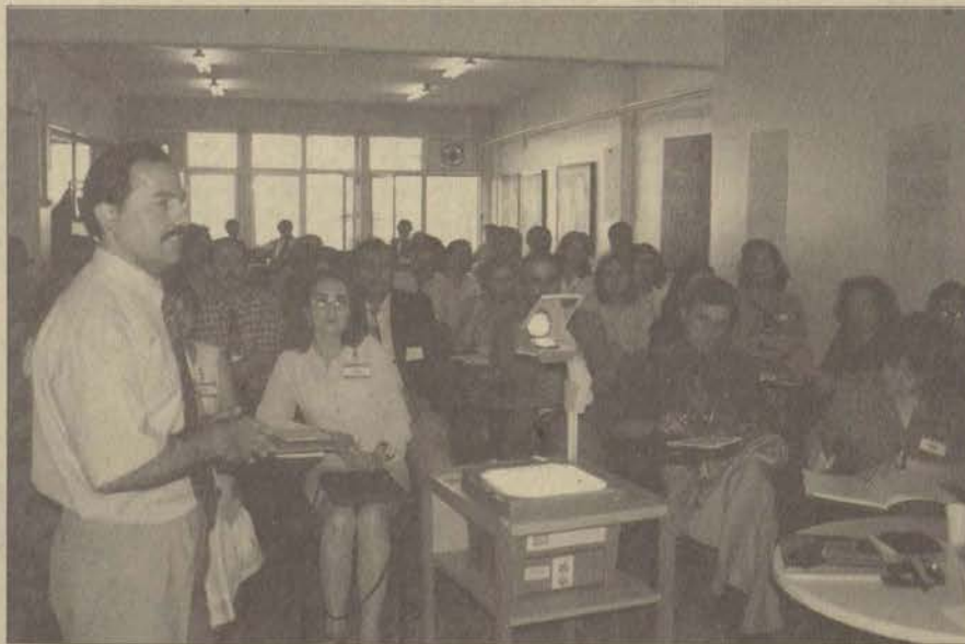
Öğretmenlik uygulamalarının nasıl yürütüleceği konusunda düzenlenen seminer büyük ilgi gördü.