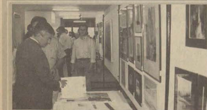
Rektör Ataç Sanat panayırına yakın ilgi gösterdi.