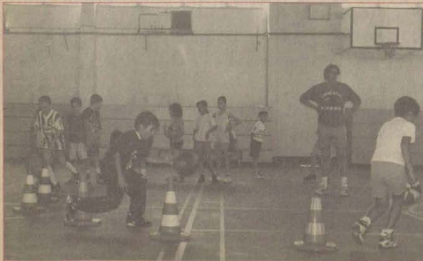
Anadolu Üniversitesi Kapalı Spor Salonu'nun bakımında olması nedeniyle minik sporcular çalışmalarına Özel Çağdaş Lisesi'nin spor salonunda devam ediyorlar