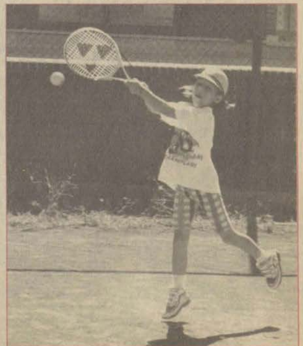
Tenise küçük yaşta başlayan minikler belki de geleceğin şampiyonları olacaklar