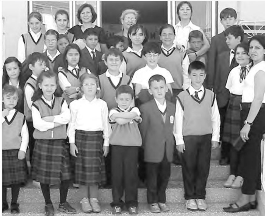
Özel Çağdaş İlköğretim Okulu öğrencileri topladıkları kitapları, 75. Yıl Yunus Emre Çocuk Yuvası'na armağan ettiler.

Kulübü öğretmen ve öğrencileri Çocuk Esirgeme Kurumu'ndaki