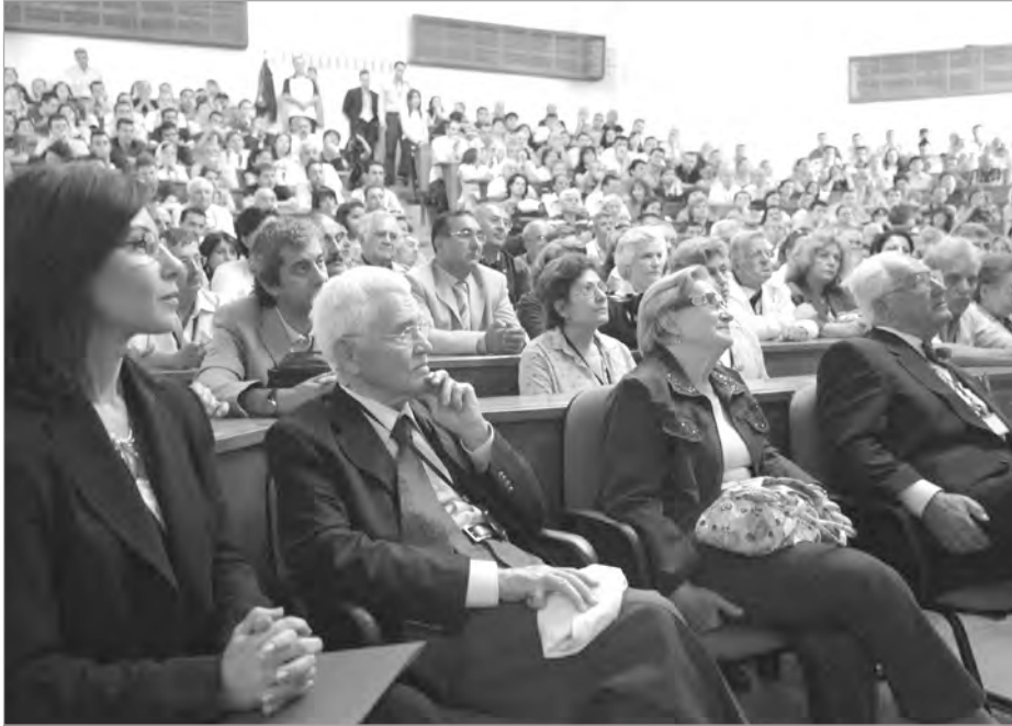
Pilav Günü, İİBF mezunlarını bir kez daha bir araya getirdi.

Çalışma öncesinde grup dinamiğini oluşturmak ve iletişimi arttırmak amacıyla ısınma ve kaynaşma etkinliği yapıldı. Daha sonra gruplar oluşturularak beyin fırtınası etkinliği ile düşünceler üretildi. Her bir grup hiçbir engelleme ile karşılaşmadan düşüncelerini paylaştı. Sonuçta, bölümün güçlü ve zayıf yönleri SWOT analiz tekniğiyle incelenerek, fırsatların ve dışardan gelebilecek olası tehditlerin neler olabileceği saptandı. Oldukça neşeli ve demokratik bir ortamda düşüncelerin üretildiği toplantı başarıyla tamamlandı.