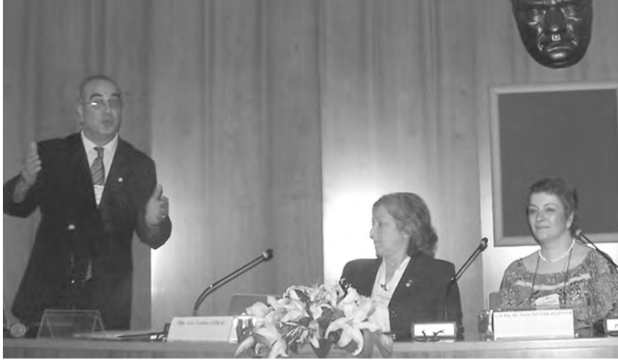
Konuşmacılar sekreterlik mesleğinin önemine dikkat çekti.