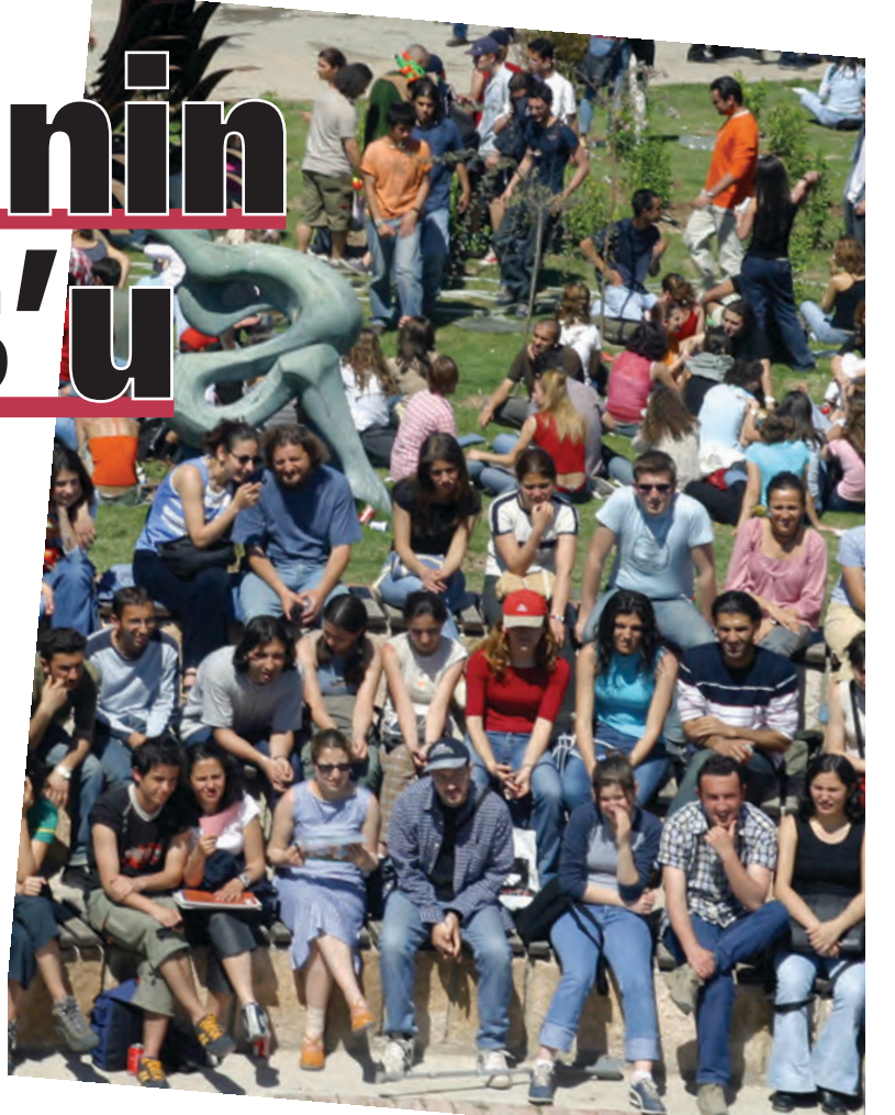
"Türkiye Erasmusu" projesi ile Anadolu Üniversitesi'nin diğer üniversitelerden büyük ilgi görmesi bekleniyor.