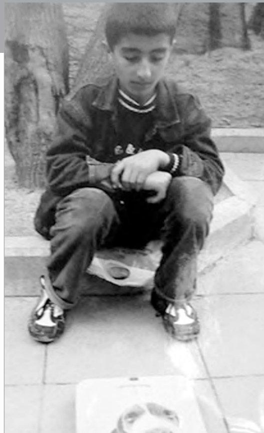
İlkokul çağındaki bir çocuk, baskülü ile şehrin sokaklarında...