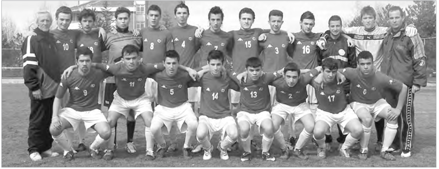
Genç Futbol Takımı, beş yıl sonra play-off'lara kalarak eski başarılı günlerine dönüş sinyalleri verdi.

ANADOLU Üniversitesi Genç Futbol Takımı, beş yıllık özlemini dindirerek play-off grubuna yükseldi. Genç takımın uyanış öyküsünü sizin için ele aldık.