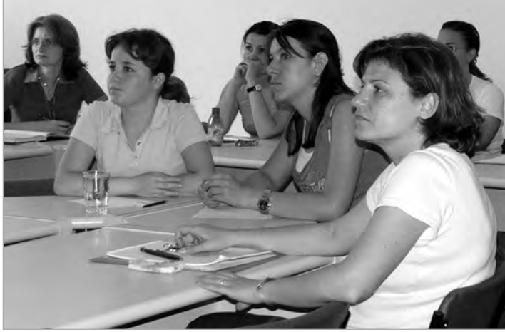
Programları tanıtmak için hizmet için eğitim düzenlendi.