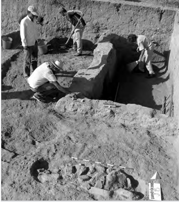
Şarhöyük'teki çalışmaların sonuçları ABD'de sunulacak.

Yüzey araştırmalarının 20 Ağustos gününe kadar devam edeceğini kaydeden Sivas, "Araştırmalarını sürdürdüğümüz bölge, Anadolu'nun M.Ö. I. bin yıl siyasi ve kültür tarihinin belli bir dönemine damgasını vurmuş olan, Frigler'in, tarihleri boyunca siyasi ve kültürel açıdan en güçlü oldukları bölgedir. Özellikle savunmaya yönelik iskan tipine olanak sağlayan fiziki çevre, zengin alüvyonlu topraklar, su kaynakları ve akarsular Frigler'e bu bölgede toprağa bağlanmak için en uygun ortamı sağlamıştır. M.Ö. 8. yüzyıl ile M.Ö. 6. yüzyılın ilk yarısı içinde bölgede birçok kale tipi Frig yerleşmesi kurulmuştur" dedi. Arkeolojik ve epigrafik çalışmaların