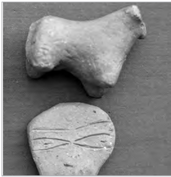
Frig Vadisi'ndeki yüzey araştırmalarında ortaya çıkarılan ve pişmiş topraktan yapılmış boğa figürleri

"Kalıntıların civarındaki çanak-çömlekler, çizimleri ve tanıtımları yapılmak üzere sistemli bir şekilde toplanarak Edebiyat Fakültesi Arkeoloji Bölümü Laboratuvarlarında incelenmiştir. Araştırmalarımız, höyüklerde, ören yerlerinde ve nekropol alanlarında kaçak kazıların her geçen gün arttığını, tahriplerin onarılamaz boyutlara ulaştığını göstermiştir. Projeimiz, bir yandan araştırma sahasında daha önceden bilinmeyen yeni kültür kalıntılarını saptayıp bilimsel açıdan değerlendirerek bölge tarihini aydınlatmayı hedeflerken, diğer yandan TUBA-TUKSEK Türkiye