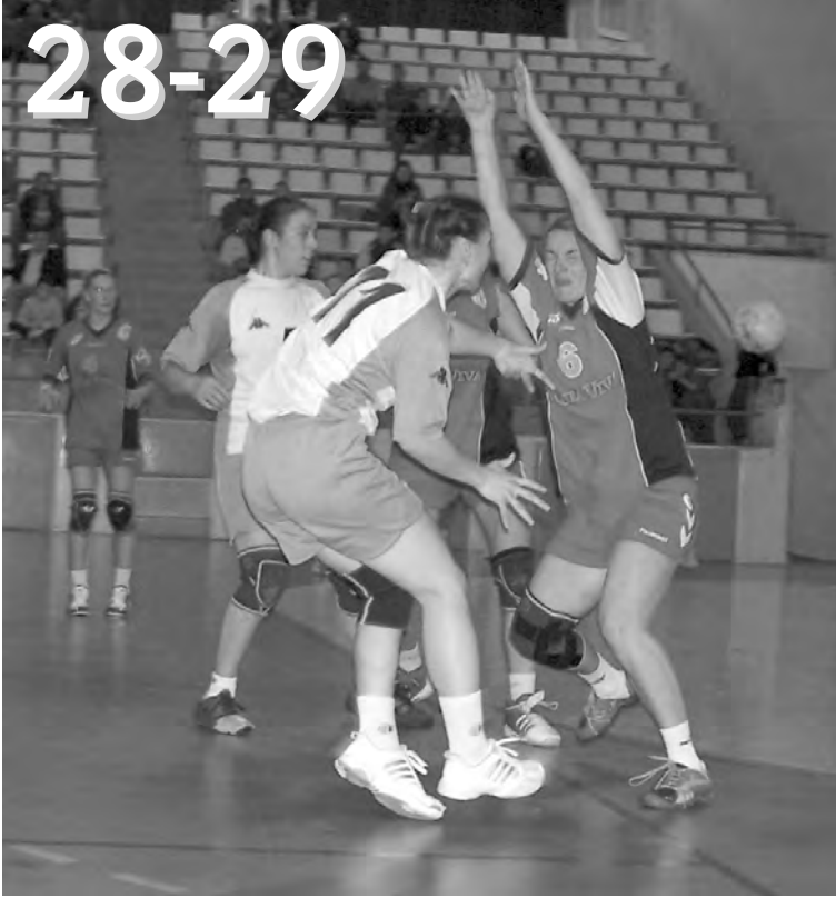
Hentbolcularımız, kadrosunda sekiz milli oyuncu bulunduran Sırp ekibine kaybetti ama mücadelesiyle rakibinin bile hayranlığını kazandı.