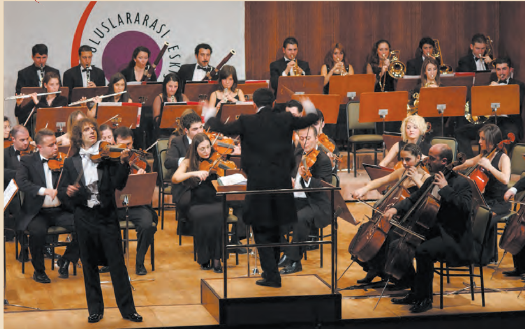
Festivalin kapanış konserini 12 Kasım akşamı Anadolu Üniversitesi Senfoni Orkestrası verecek.

Uluslararası Eskişehir Festivali 12'nci kez sanatseverlerle buluşuyor.