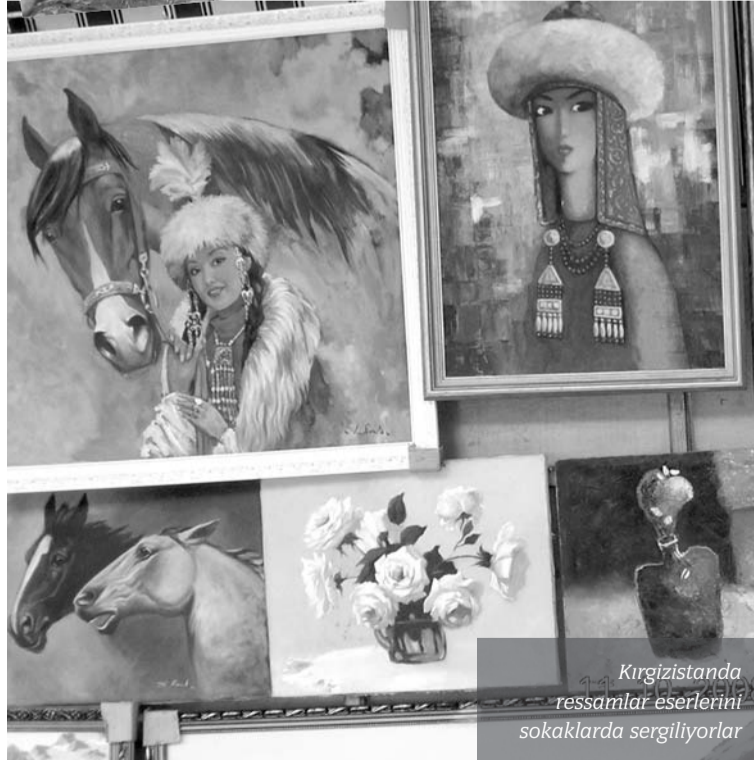
Kirgizistanda ressamlar eserlerini sokaklarda sergiliyorlar