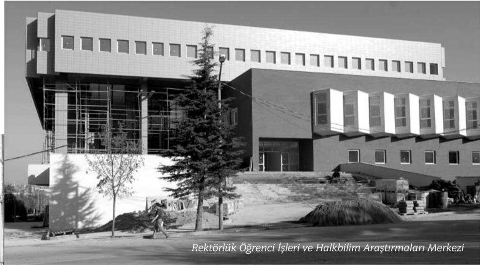
Rektörlük Öğrenci İşleri ve Halkbilim Araştırmaları Merkezi

2007 yılının Ağustos ayında inşaatına başlanan ve 22 bin metrekare alanda kurulan rektörlük öğrenci işleri ve Halk Bilim Araştırmaları Merkezi inşaatında son noktaya gelindi. İnşaat yıl sonuna kadar bitirilerek bina kullanıma açılacak. Bi-