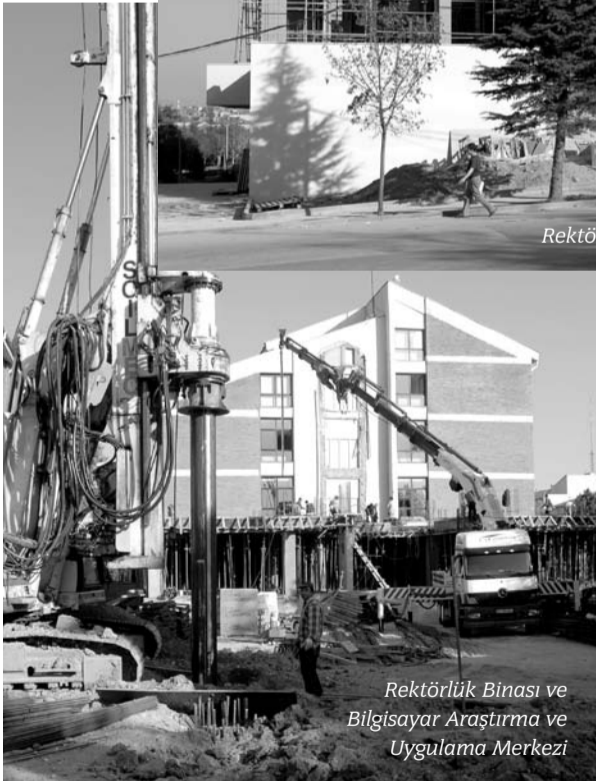
Rektörlük Binası ve Bilgisayar Araştırma ve Uygulama Merkezi

için yeni bir ek blok oluşturulması için inşaat çalışmalarına başlanıldı. Rektörlük binasının hemen arkasında oluşturulması planlanan ek blokta, bir toplantı salonu, 11 büro, 2 depo ve 1 temizlik odası yer alacak. Rektörlük ek bloğu ocak ayına kadar yetiştirilecek.