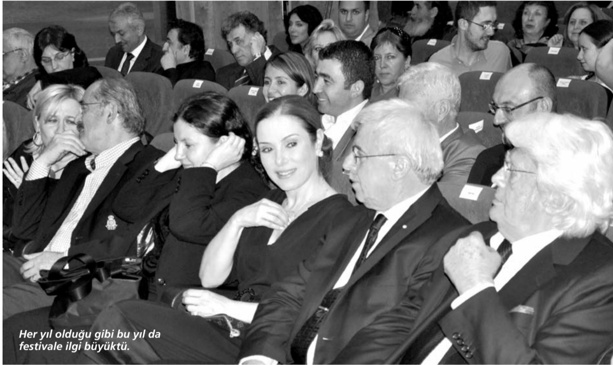
Her yıl olduğu gibi bu yıl da festivale ilgi büyüktü.