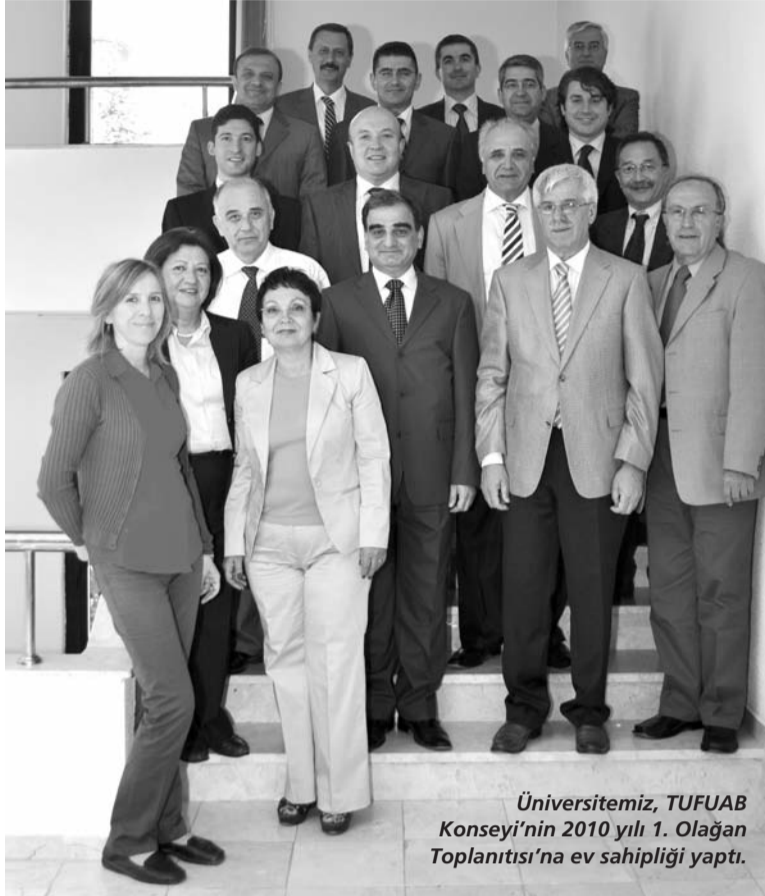
Üniversitemiz, TUFUAB Konseyi'nin 2010 yılı 1. Olağan Toplantısı'na ev sahipliği yaptı.

Rektör Aydın, farklı kurumlarla iş birliğine açık olduklarını söyledi. Uzaktan