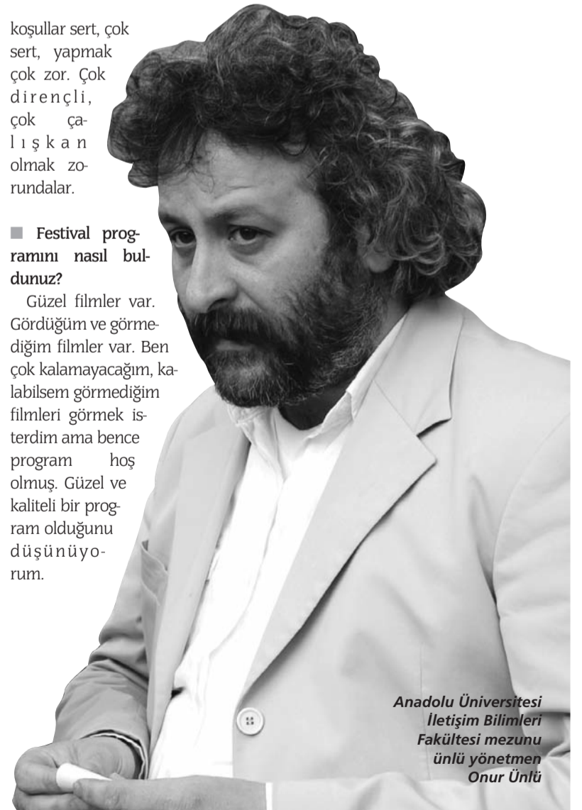
Anadolu Üniversitesi İletişim Bilimleri Fakültesi mezunu ünlü yönetmen Onur Ünlü

oynatırcasına çalışacaklar. Sürekli, hiçbir boşluk bırakmayacaklar. İzleyecekler, okuyacaklar, çalışacaklar, başka yolu