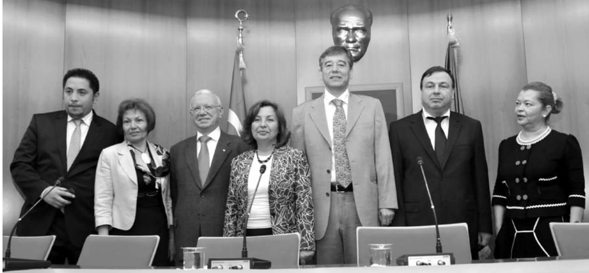
Eczacılık Fakültesi'nin düzenlediği ve ülkemizde benzeri olmayan sempozyumun bu yıl üçüncüsü gerçekleştirildi.

Türk Eczacılar Birliği Başkanı Ecz. Erdoğan Çolak da "Bu sempozyum sayesinde, geleceğin eczacıları ile bir araya gelmek beni çok mutlu ediyor" dedi. Çolak, gündemde yer alan ilaç takip sis-