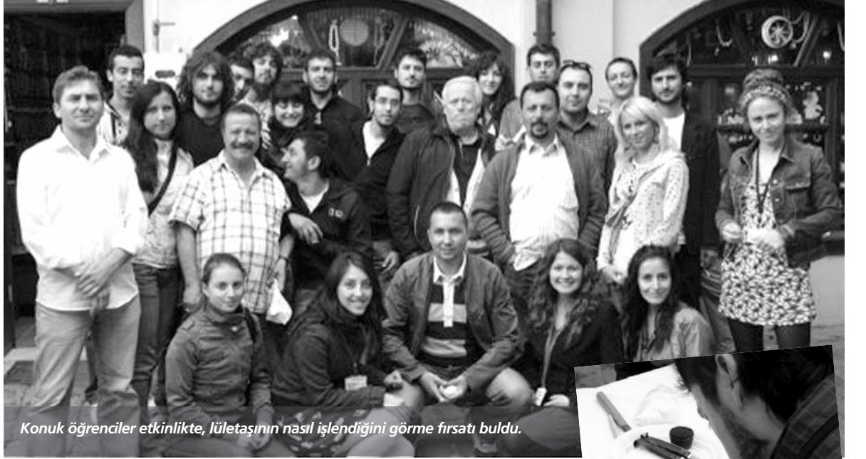
Konuk öğrenciler etkinlikte, lületaşının nasıl işlendiğini görme fırsatı buldu.

Çalışma, Eskişehir halkı ve Eskişehir'de öğrenim gören Erasmus öğrencilerinin büyük ilgiyle karşılaştı. Çalışma