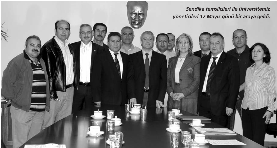
Sendika temsilcileri ile üniversitemiz yöneticileri 17 Mayıs günü bir araya geldi.

Eğitim ve Bilim Emekçileri Sendikası (EĞİTİM SEN) ve Sağlık ve Sosyal Hizmet