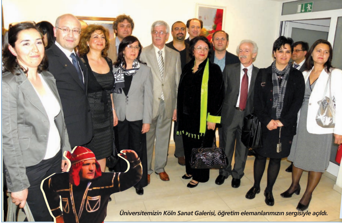
Üniversitemizin Köln Sanat Galerisi, öğretim elemanlarımızın sergisiyle açıldı.

■ Üniversitemizin Almanya'nın Köln kentindeki AÖF bürosunun zemin katında hayata geçirdiği sanat galerisi 29 Mayıs günü törenle açıldı.