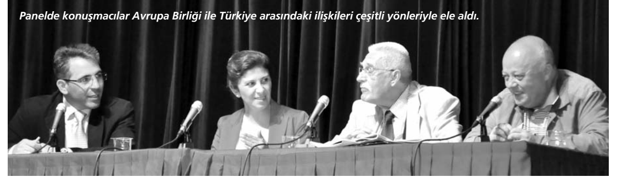
Panelde konuşmacılar Avrupa Birliği ile Türkiye arasındaki ilişkileri çeşitli yönleriyle ele aldı.

Avrupa Birliği projesinin 20. yüzyıla ait bir proje olduğunu ifade eden Yakut, Türkiye toplumunun modernleşme arayışları içinde AB ile olan diyalogu ve kırılma noktalarının siyasi, ekonomik ve ideolojik özellikleri konusunda bilgi verdi. Doç. Dr. Yakut, Osmanlı'daki ilk modernleşme çabalarının Avrupa'daki otoritesi sarsılan Osmanlı'nın eski altın çağlarına geri döndürülmesi amacı ile başlatılan Batılılaşma hareketlerinin devlet politikası haline getirilmesi oldu-