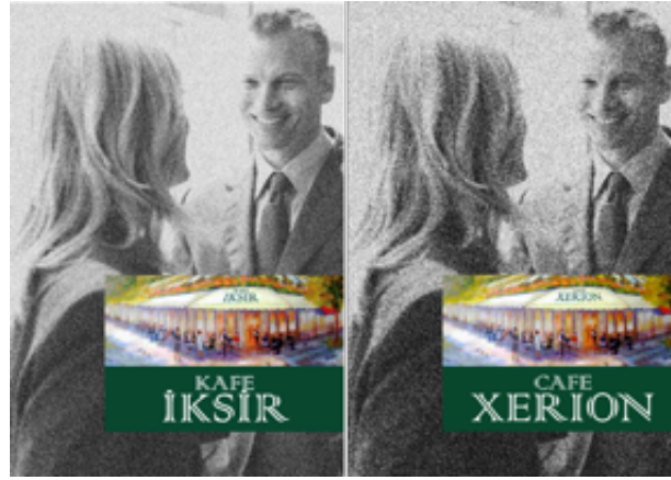
Şekil 2. Kafe Markalarına Ait Reklam Görselleri