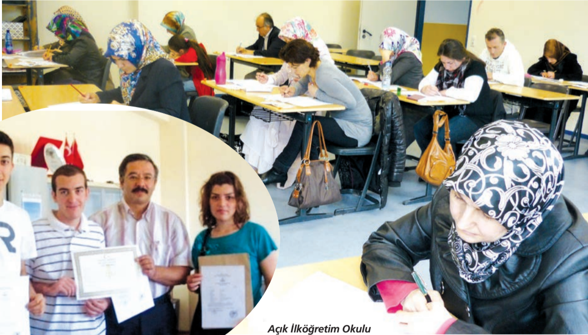
Açık İlköğretim Okulu Batı Avrupa Programı, öğrencilerine yeni bir gelecek sunuyor.

Program, herhangi bir nedenle öğrenimlerine devam edemeyen kişilere okula gitme zorunluluğu olmadan, evinden, işinden ayrılmadan kendi kendine çalışarak bir üst öğrenime devam etme olanağı sağlıyor. Açık İlköğretim Okulu Batı Avrupa Programından mezun olan kişiler Türkiye'deki liselere ya da Açık Öğretim Lisesi Batı Avrupa