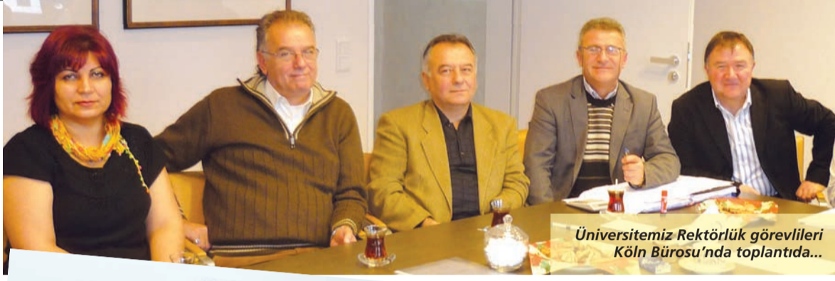
Üniversitemiz Rektörlük görevlileri Köln Bürosu'nda toplantıda...

Binanın giriş katı bilim, sanat ve kültür etkinliklerine ayrıldı. Binada ilköğretim, lise, yükseköğretim, yüksek lisans, halkla ilişkiler, mali işler ve yönetici odaları dışında kalan mekânda Türkiye'den gelen ve bilimsel çalışma yapan öğretim elemanları için donanımlı çalışma ofisi, video konferans ve çeşitli toplantıların yapıldığı çok amaçlı salon, ziyaretçilerin kabul edildiği, toplantı ve tanıtım faaliyetlerinin yürütüldüğü görsel ve işitsel sunum