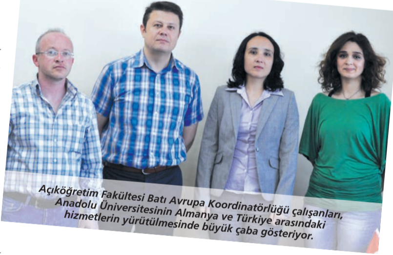
Açıköğretim Fakültesi Batı Avrupa Koordinatörlüğü çalışanları, Anadolu Üniversitesinin Almanya ve Türkiye arasındaki hizmetlerin yürütülmesinde büyük çaba gösteriyor.

için gerekli donanıma sahip bir de salon bulunuyor.