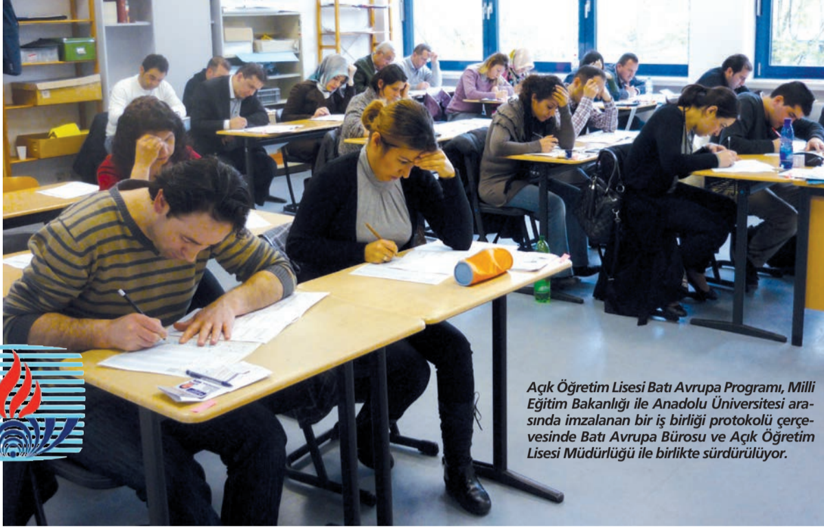
Açık Öğretim Lisesi Batı Avrupa Programı, Milli Eğitim Bakanlığı ile Anadolu Üniversitesi arasında imzalanan bir iş birliği protokolü çerçevesinde Batı Avrupa Bürosu ve Açık Öğretim Lisesi Müdürlüğü ile birlikte sürdürülüyor.

Program, ilk olarak "Yurt Dışında Dışarıdan Lise Bitirme" projesi adıyla