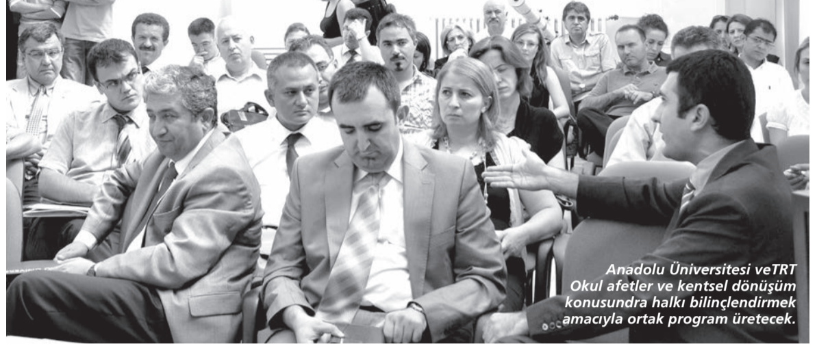
Anadolu Üniversitesi ve TRT Okul afetler ve kentsel dönüşüm konusunda halkı bilinçlendirmek amacıyla ortak program üretecek.

"Rektörümüzün vizyonu ile bizler de ilgili birimlerin yöneticileri olarak mümkün olduğunca eğitim ve araştırma faaliyetlerinin dışında topluma hizmet faaliyetlerini de yerine getirmeye çalışıyoruz. Enstitü olarak bizim vizyonumuz; afetlerin yani doğanın tehdit etmediği çevreye zarar vermeyen, doğaya tehdit olmayan insan yerleşimleri için öncelikle yeri ve doğayı anlamaya çalışmak ve buna bağlı olarak da birtakım planlama ve mühendislik çalışmalarını hayata sokmak. Bu kapsamda en önemli ek-